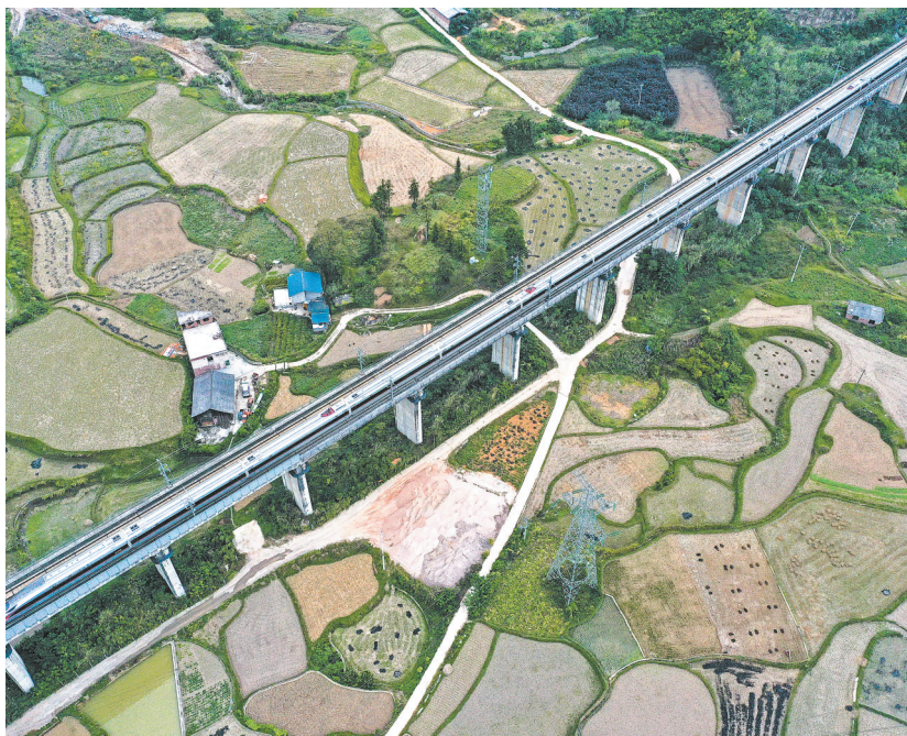
10月10日，列车在贵广高铁贵州省都匀市境内行驶(无人机照片)。中国国家铁路集团有限公司宣布，10月11日起，经过提质改造后的贵广高铁最高时速达300公里运营，西南地区至粤港澳大湾区间高铁运行时间将进一步压缩。

据悉，连接贵州省贵阳市与广东省广州市的贵广高铁于2014年12月26日全线通车，此前按时速250公里运营。