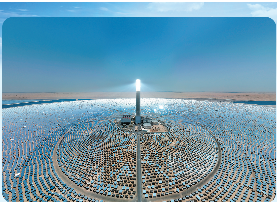
今年恰逢共建“一带一路”倡议提出十周年。十年来，“一带一路”倡议合作硕果累累，陆续建成的一系列标志性项目助力各国发展，为各国人民带来实实在在的好处。从空中俯瞰，这些“国家地标”尽显恢弘大气，成为“中国建造”的闪亮名片。

左图：这是2022年8月15日在阿联酋迪拜拍摄的上海电气迪拜光热光伏复合项目。位于阿联酋迪拜的700MW光热和250MW光伏复合项目由上海电气集团股份有限公司总包，装机规模大、技术标准高，助力阿联酋实现清洁能源目标。