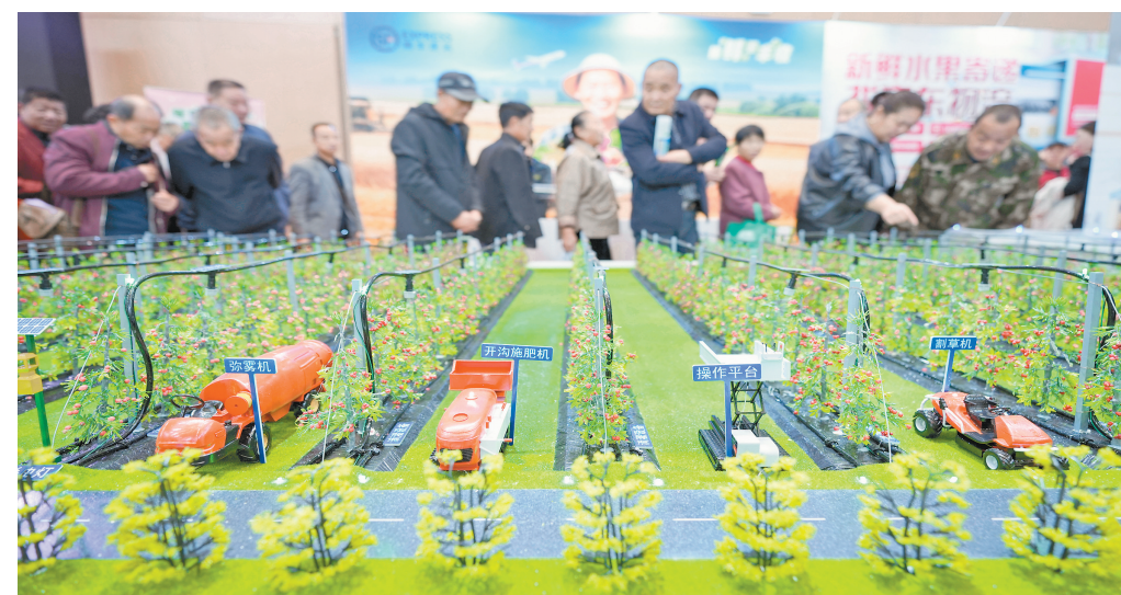
市民在主题馆参观“三新”果园沙盘模型。