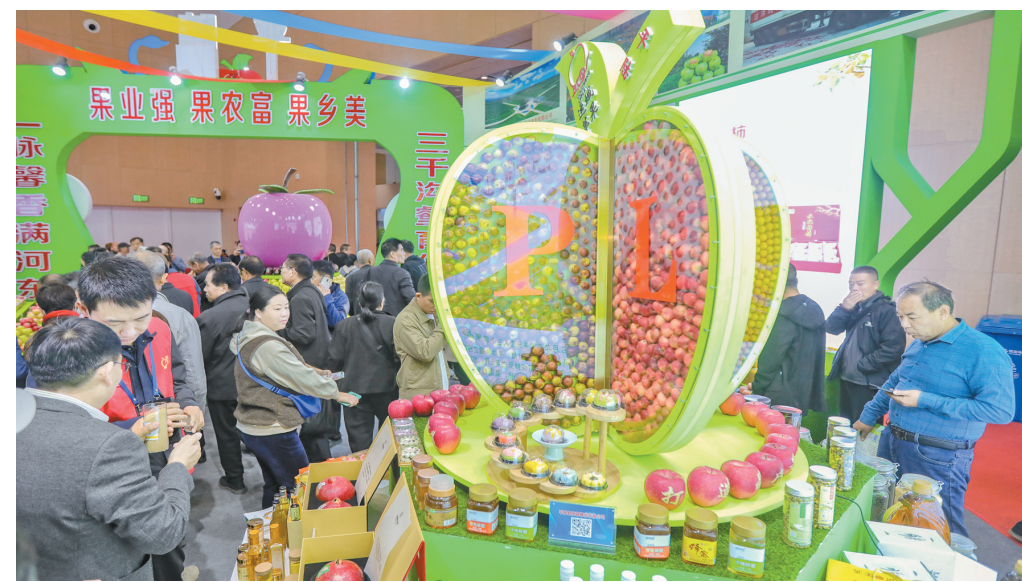
市民在主题馆内参观。