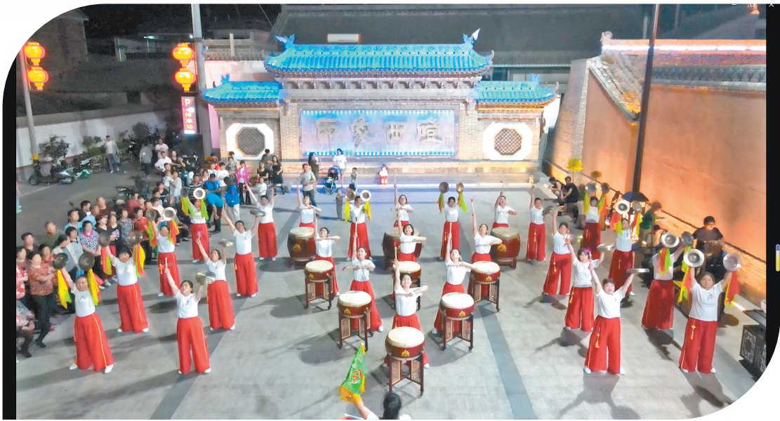
西磴村女子威风锣鼓队在西磴广场表演节目。(资料图片)