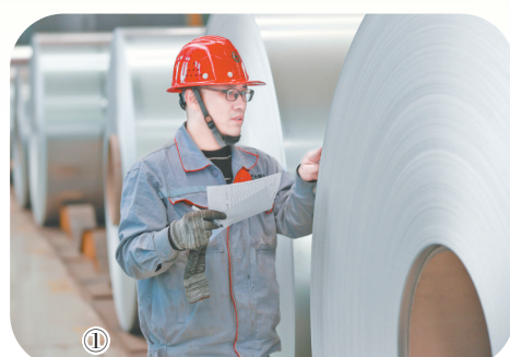
图① 山西建龙实业有限公司车间内，质检员在对产品质量进行检测。