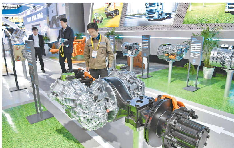
11月16日，观众在第七届丝博会上参观一款电驱桥总成。