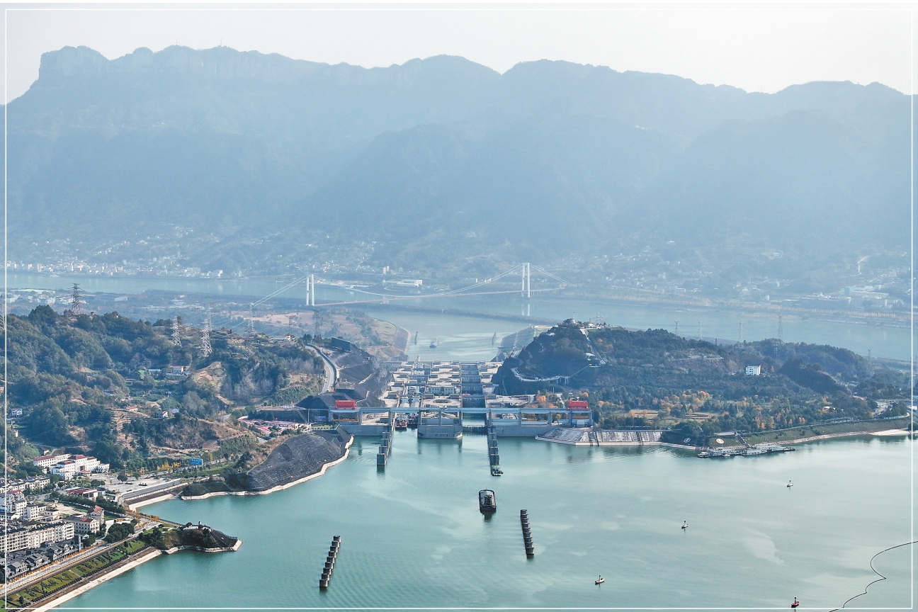
11月24日，在湖北省宜昌市，船舶有序通过三峡双线五级船闸(无人机照片)。当日，记者从交通运输部获悉，截至23日18时，三峡枢纽航运通过量达1.6亿吨，已突破历年最高水平。其中三峡船闸运行10148闸次，通过量1.56亿吨；三峡升船机运行4187厢次，通过量437.89万吨。

规定强调，给予违规违纪违法行为的事业单位工作人员处分，应当与其违规违纪违法行为的性质、情节、危害程度相适应；应当事实清楚、证据确凿、定性准确、处理恰当、程序合法、手续完备。同时，规定明确，教育、科研、文化、医疗卫生、体育等部门，可以结合自身工作的实际情况，与中央事业单位人事综合管理部门联合制定具体办法。