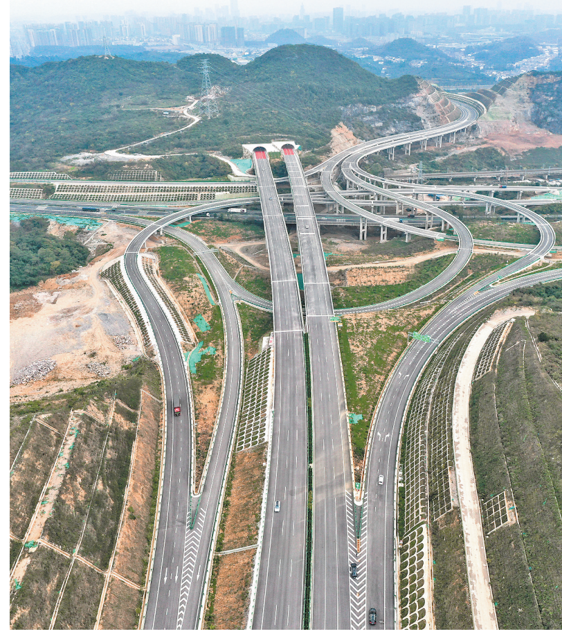
11月24日，车辆在贵阳高速公路官宾枢纽互通上行驶(无人机照片)。当日，贵阳经金沙至古蔺(黔川界)高速公路(贵金高速)正式通车运营。贵金高速是国家高速公路网规划，贵阳至成都高速公路(筑蓉高速)的重要组成部分，主线全长165.284公里，成为连接贵阳和成都两个省会的便捷高速公路通道，对提升贵阳至成渝经济区通道运输能力，加快黔中经济区建设具有重大意义。

婉转低回的《思念曲》再次吹响。礼兵迈着无声、庄重的步伐抬起烈士棺椁，绕场半周，缓步走向安葬地宫。此时，阳