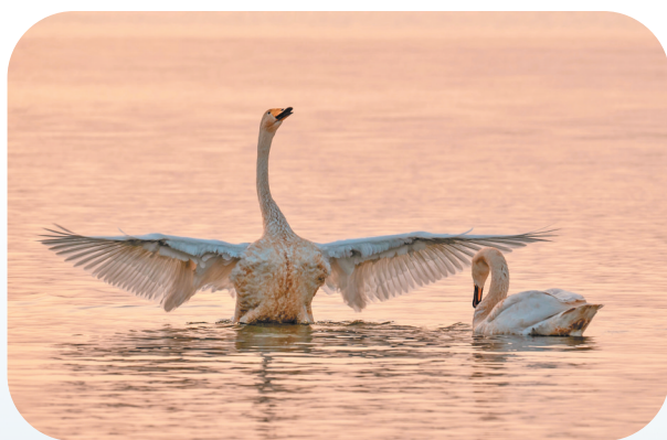
本版责编 董战轩 美编 冯潇楠 校对 李静坤