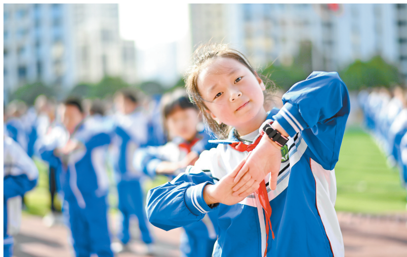
小学生在做课间操。