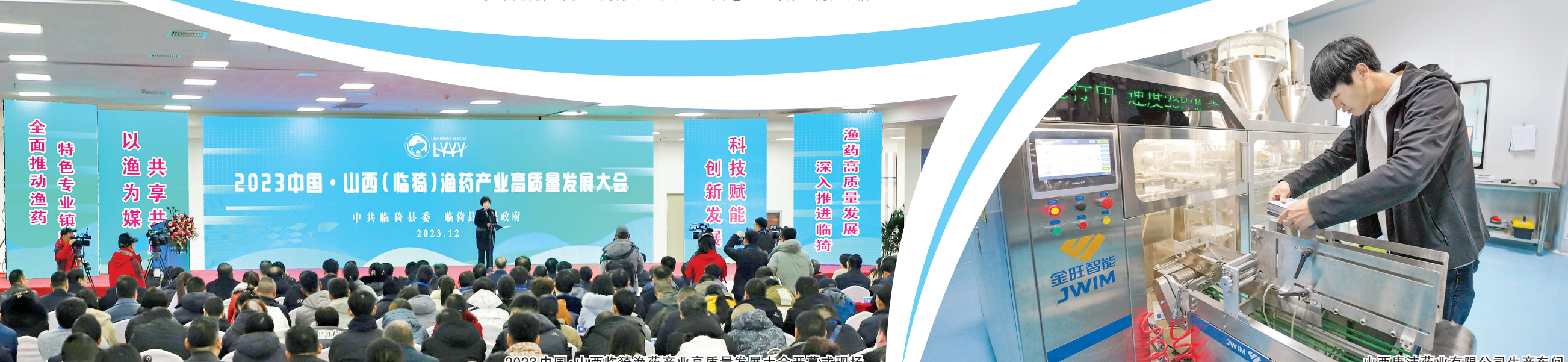
2023中国·山西临猗渔药产业高质量发展大会开幕式现场