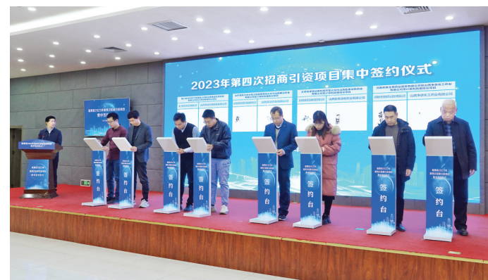
临猗县举行2023年第四次项目集中签约仪式。