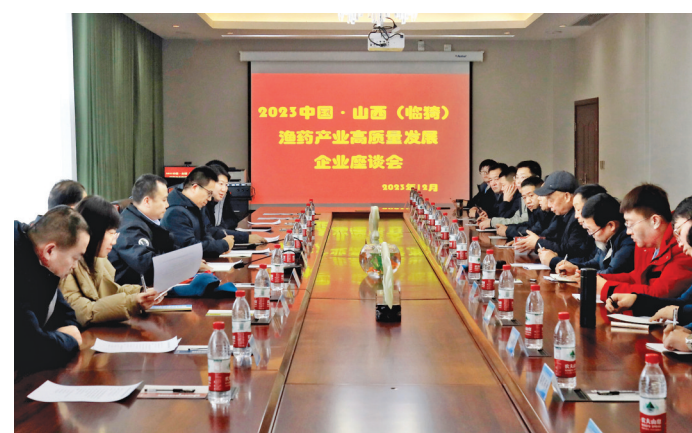
临猗县举办渔药产业高质量发展企业家座谈会。