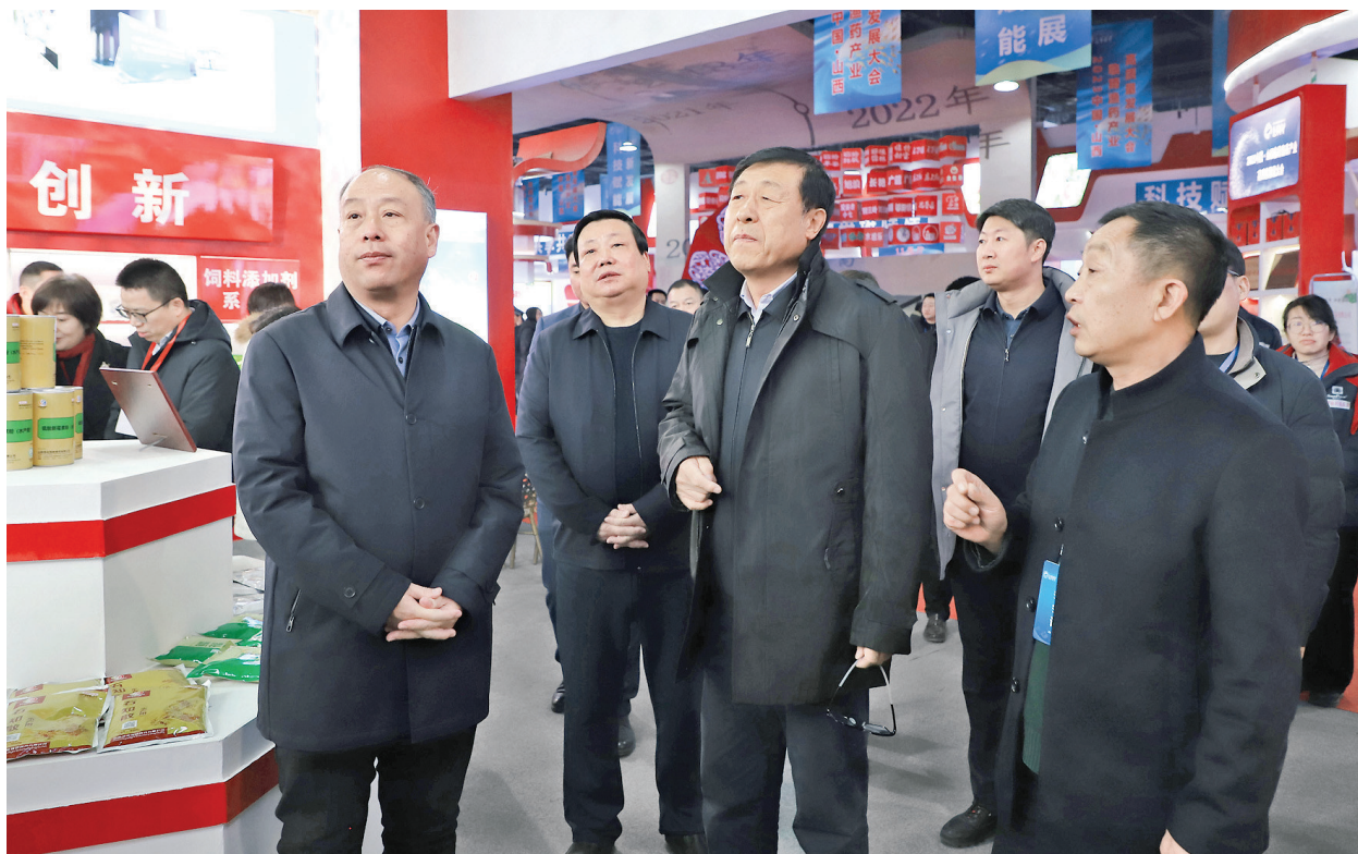
与会领导和嘉宾在2023中国·山西临猗渔药产业高质量发展大会展厅巡展。

“我们特地带来了国标系列产品和饲料系列产品，‘拳头产品’有聚维酮碘溶液和VC解毒应激宁。希望通过大会与更多的渔药经销商和渔民进行交流，了解他们的需求，把‘临猗渔药’品牌