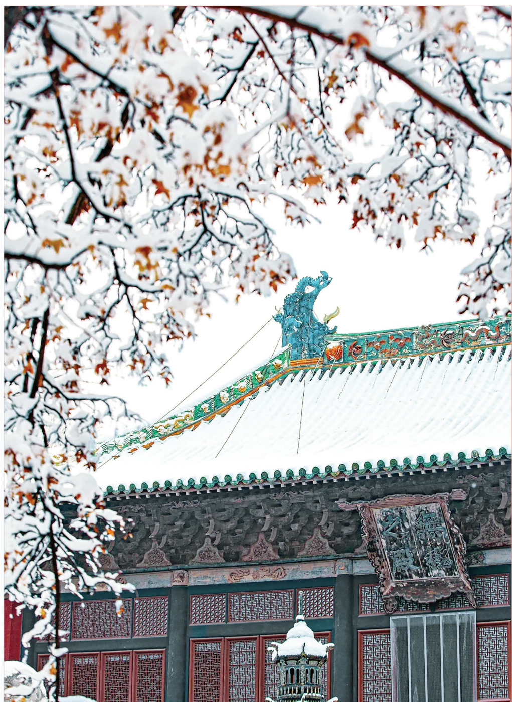
红墙、白雪、琉璃瓦……雪中的永乐宫宏伟壮丽，尽显威严庄重，纯白的雪，如一张轻薄的白纱，覆盖在永乐宫的每一个角落。移步换景，美不胜收。