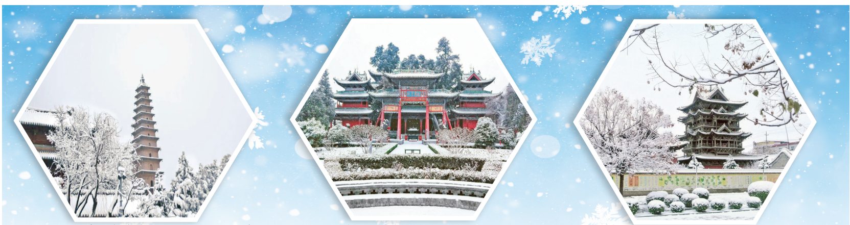
雪天的普救寺莺莺塔若隐若现，诉说着曾经发生于此的美丽爱情故事。

1月15日，运城市迎来2024年初雪，运博也被笼罩其中，更显厚重。在一片白茫茫中，运博之外的众多国保更添一份意境，古建与雪景相融，为游客铺开了观光游览运城的新视角。