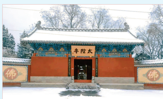
骤然飞雪至，使得原本就神秘悠远的太阴寺越发显得古雅幽深。