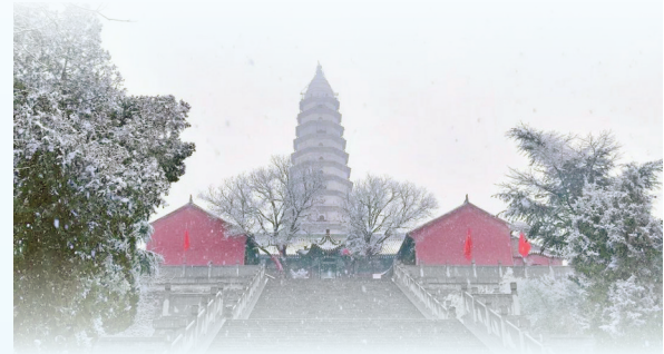
历史悠久的千年古刹新绛龙兴寺红墙青瓦上覆着圣雪，白雪点缀的塔檐重重叠叠，神韵悠悠。