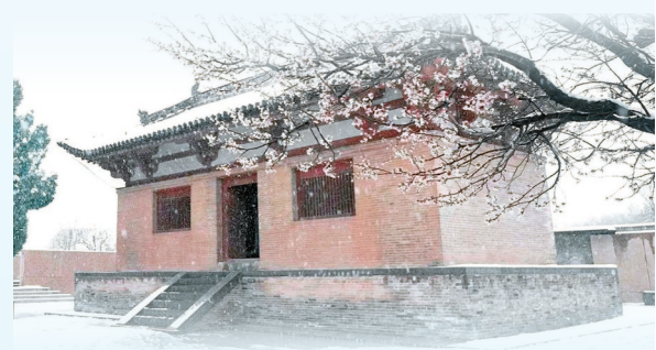
广仁王庙的雪景如诗如画，银装素裹，美不胜收。踏雪寻幽，可以感受天地间纯净之美。