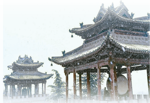
雪中的稷山大佛寺简直成了一幅唯美的画卷，古老的寺庙，木构的殿堂，珍贵的土雕大佛，若隐若现于飞雪之中，别有韵味。