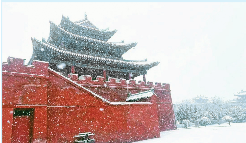
▲层层堆雪勾勒绛州古城的轮廓，雪中的红墙、灰瓦瞬间将游客拉回到绛州曾经的繁华。