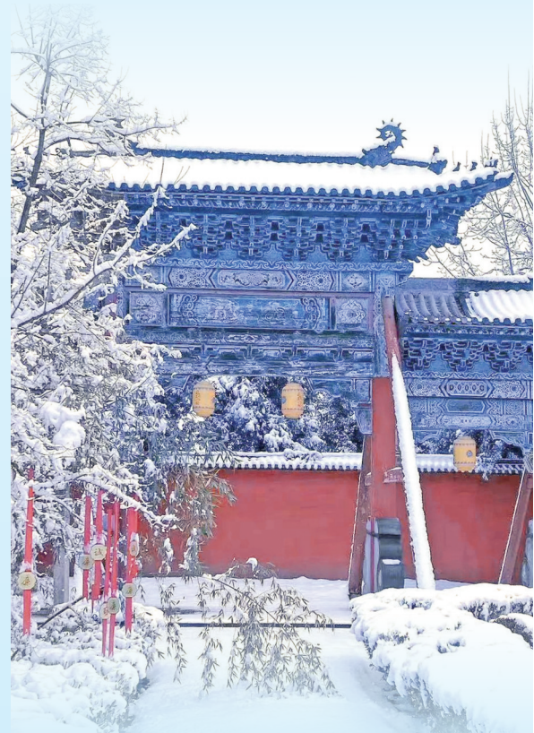
▲司马光祠被白雪覆盖，呈现出别样的风景。