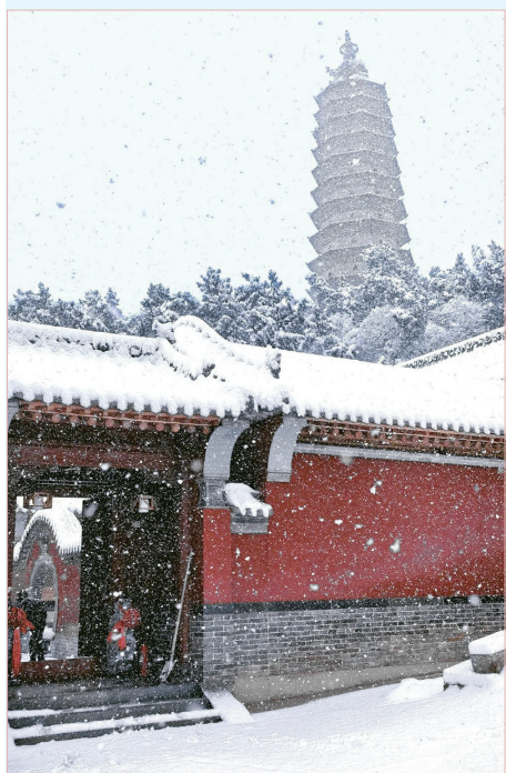
银装素裹下的永济万固寺。