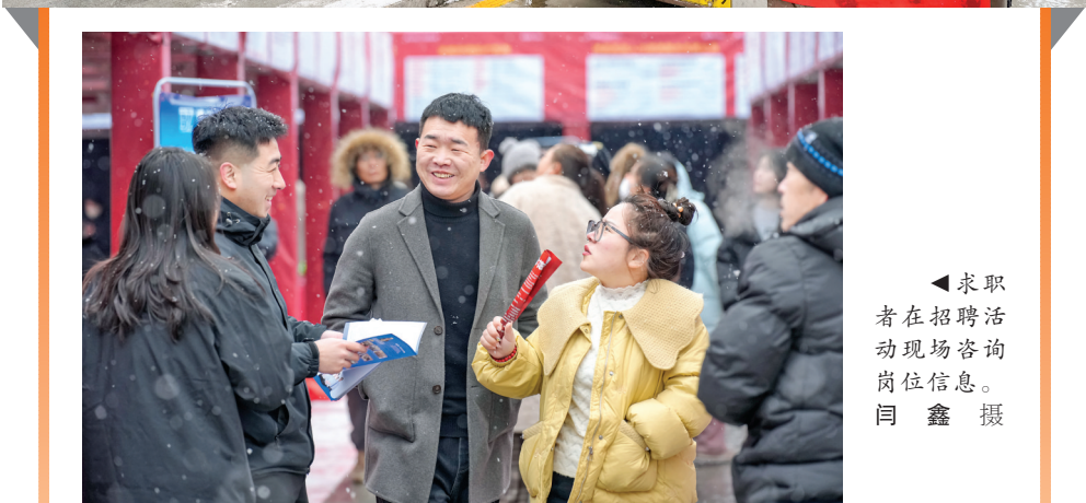
求职者现场咨询岗位信息。