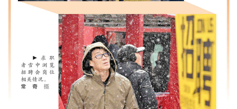
求职者雪中浏览招聘会岗位相关情况。