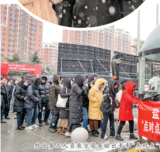
外务工人员乘坐劳务输出专车“点对点”就业。