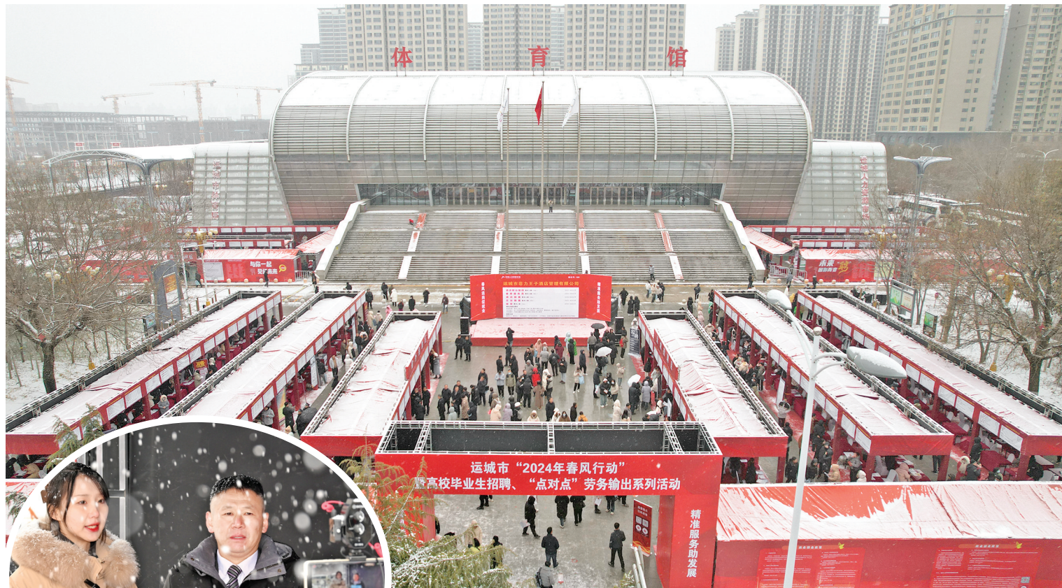
▲2月21日,运城市“2024年春风行动”暨高校毕业生人力资源招聘会大会现场。