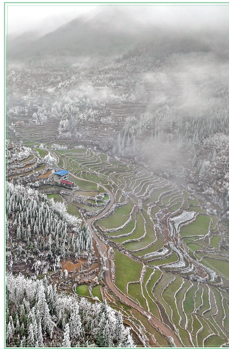
这是桂林市全州县蕉江瑶族乡大源村的雪景(2月28日摄)。连日来,受强冷空气影响,广西桂林市全州县蕉江瑶族乡持续冰雪天气,瑶寨梯田被冰雪覆盖,美如画卷。