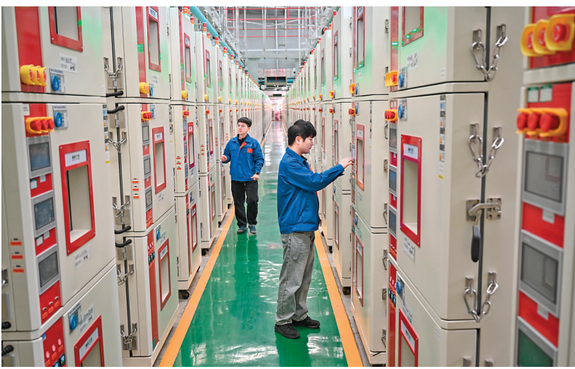
2024年2月19日，在福建省宁德市，宁德新能先锋检测科技有限公司工作人员在电芯实验室查看设备运行情况。

“相比传统制糖方式，实现了从‘年’到‘小时’的跨越。”中国科学院天津工业生物技术研究所研究员马延和代表率领团队“十年磨一剑”，不断拓宽生物技术新赛道。 生物制造，把车间“装”进小小细胞；生物医药，将健康带给千家万户……生物经济迈上新台阶，为中国高质量发展的进行曲增添又一个重音。 中国全球创新指数排名已从2011年第29位上升至2023年第12位。代表委员们表示，创新曲线上扬彰显了发展新质生产力的底气。 有这样的底气更足，要把握好发展新质生产力的实践要求。 习近平总书记在参加江苏代表团审议时强调：“发展新质生产力不是忽