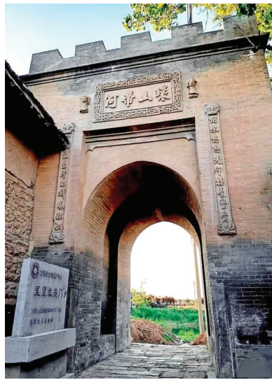
汉薛玉帝阁正中明间脊枋题字。