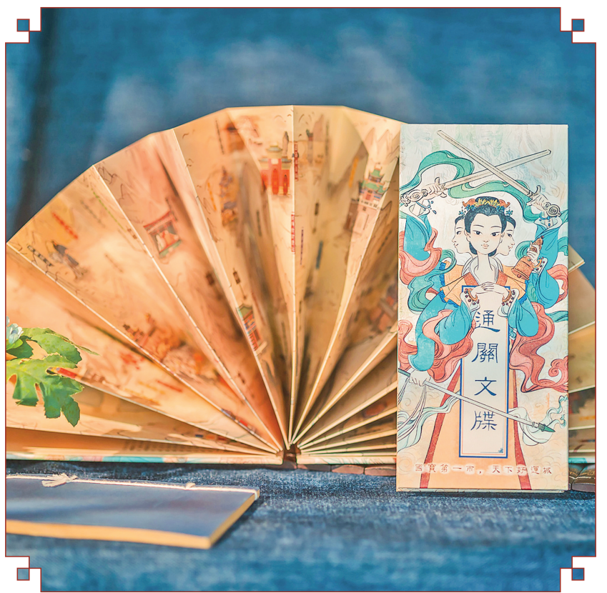
永乐宫文创通关文牒

“咚、咚、咚”，3月26日下午4时许，随着三下清脆的敲门声，快递小哥推门而入，“您好，是这里要寄件吧？”小哥简短询问一下，很熟悉地走进房间拿起放在桌子上的快递，“10件，没问题吧。”