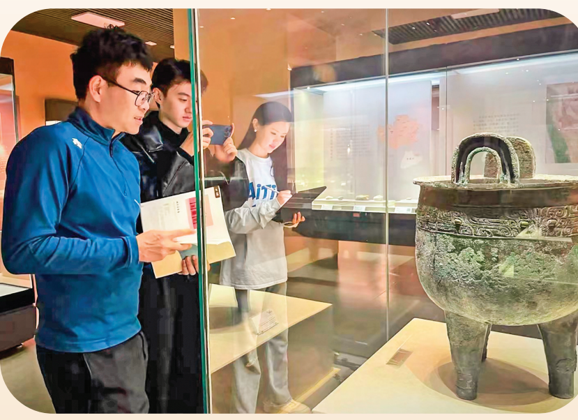
“之云造物”创意团队在博物馆参观学习。（资料图片）