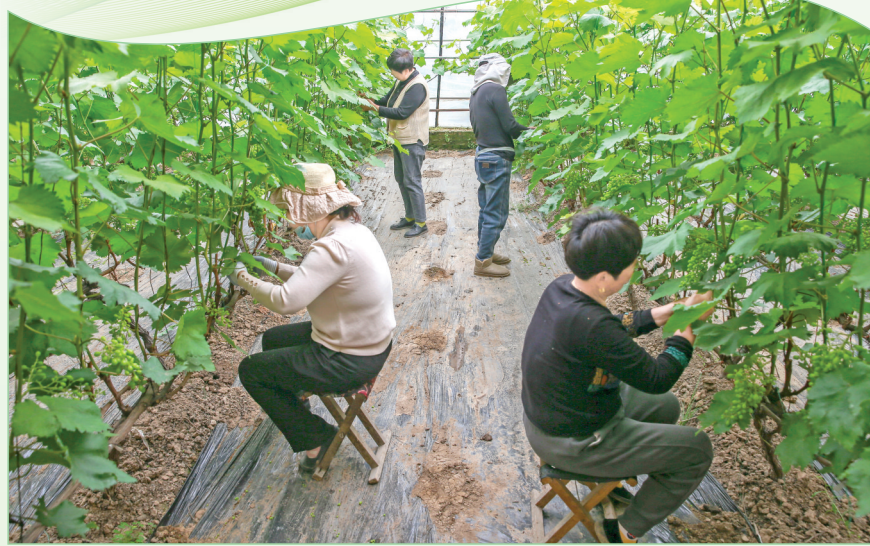
上图：4月8日，盐湖区陶村镇张良村村民在田间进行春耕。