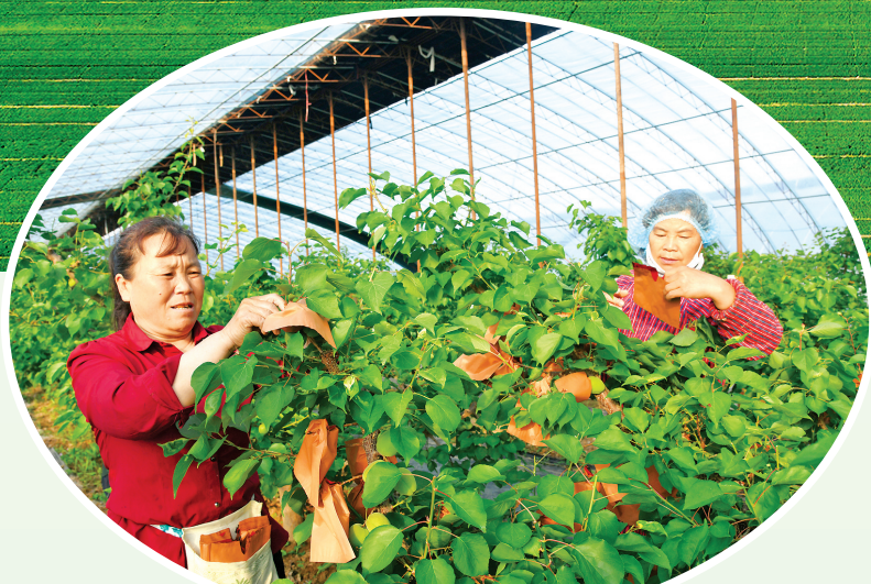
▲4月11日，果农在闻喜县郭家庄镇宋店村大棚杏科技示范园给杏树套袋。