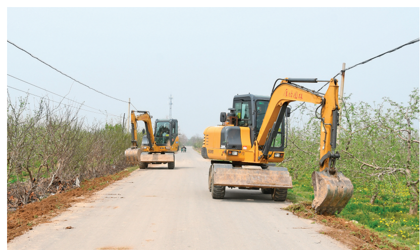
4月6日，临猗县北景乡尉庄村组织挖掘机整修路肩。近期，该村组织机械、人员对通村道路两旁的路肩进行统一整修，在便利村民出行、耕作的同时，大大美化了乡村环境。

下一步，杜马乡将以此次文化旅游节为契机，进一步加强基础设施建设，提升服务水平，打造更多精品旅游线路和产品，助推群众增收致富，助力全域旅游示范区创建。