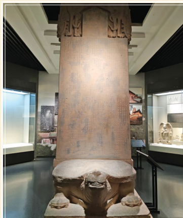
隋栖岩道场舍利塔碑

商弦纹双菌柱平底锥足铜爵，一级文物。酒器，青铜铸造，长流，短尾，双菌柱，束腹，平底，三锥足，单柄。腹施弦纹。