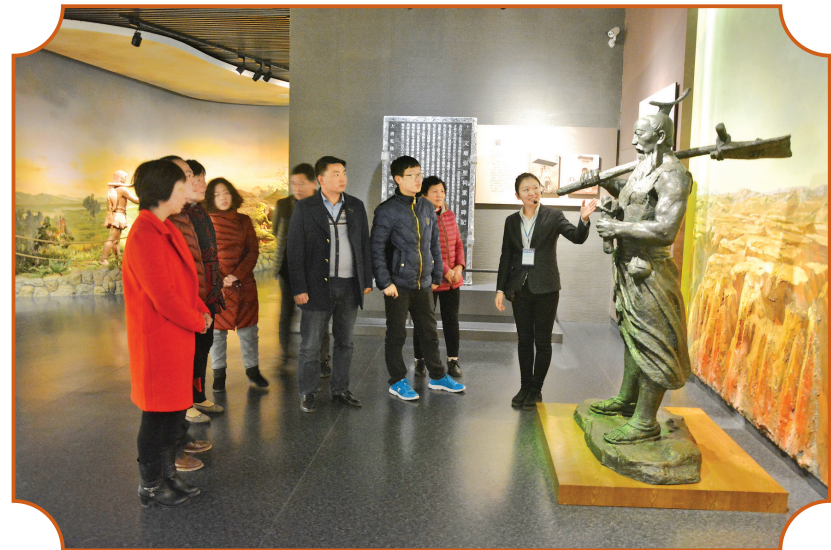
工作人员为游客讲解。