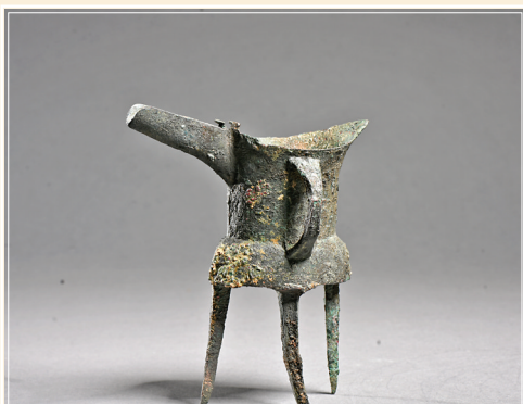
商弦纹双菌柱平底锥足铜爵

战国蟠螭纹三兽钮盖铜鼎，一级文物。饪食器、礼器，青铜铸造，三兽钮盖，鼓腹，兽面铺首衔环，矮蹄足，底平。盖、腹满施蟠螭纹，以弦纹间隔。