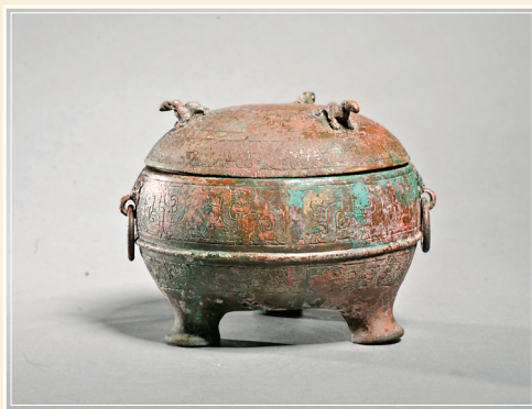
战国蟠螭纹三兽钮盖铜鼎

战国蟠螭纹三兽钮盖铜鼎，一级文物。饪食器、礼器，青铜铸造，三兽钮盖，鼓腹，兽面铺首衔环，矮蹄足，底平。盖、腹满施蟠螭纹，以弦纹间隔。