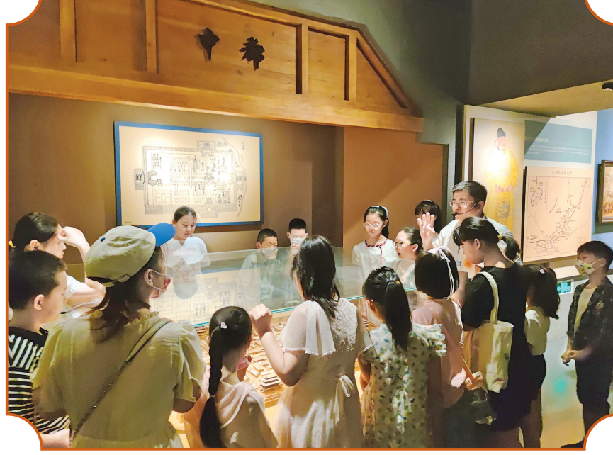
青少年在永济博物馆参观。

在永济博物馆的一张圆桌上，摆放着两本“活动日志”，分别来自两所小学，记录着孩子们游览永济博物馆的真实感受。“一下汽车，一座气派的建筑呈现在眼前……最让我好奇的是警署纹圈足铜爵……”稚嫩真诚的记录写在稿纸上，这是孩童与历史文化的照面，也是博物馆发挥自身功能的生动写照。