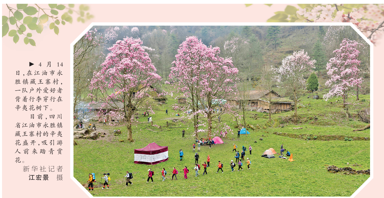
▲4月14日，在江油市永胜镇藏王寨村，一队户外爱好者背着行李穿行在辛夷花树下。目前，四川省江油市永胜镇藏王寨村的辛夷花盛开，吸引游人前来踏青赏花。