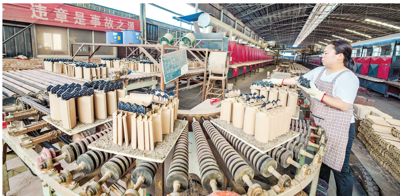
▲天津市鑫泰琉璃灰陶有限公司的灰陶琉璃制品自动生产线。

和科技局相关负责人介绍道。在吕氏祖传琉璃厂的展示厅内,记者见到了关公夜读春秋、孔雀蓝色琉璃瓶等琉璃制品。琉璃工艺堪称中华民族的艺术瑰宝,也是华夏文明的重要载体和文化元素。