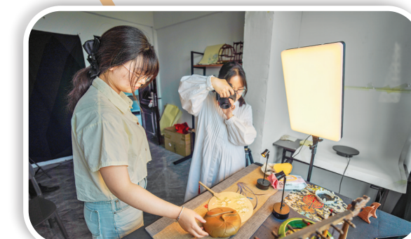
▲涿州澄泥砚文化园内,工作人员在为澄泥砚拍摄推广视频素材。