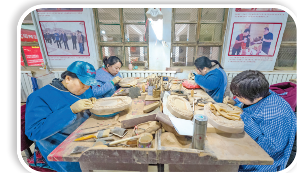
▲技术人员在砚台上雕刻花样。