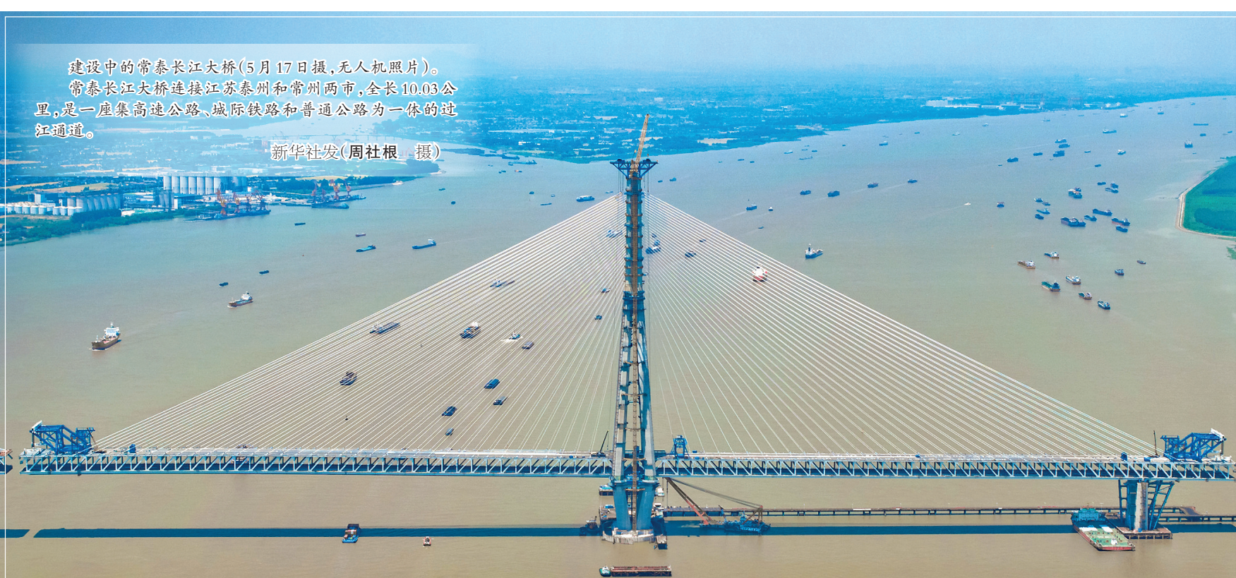
建设中的常泰长江大桥(5月17日摄，无人机照片)。常泰长江大桥连接江苏泰州和常州两市，全长10.03公里，是一座集高速公路、城际铁路和普通公路为一体的过江通道。

据悉，POPs是指具有环境持久性、生物蓄积性、远距离环境迁移的潜力，并对人体健康或生态环境产生不利影响的有机污染物。《关于持久性有机污染物的斯德哥尔摩公约》2004年5月17日生效。2004年11月11日公约对中国生效。