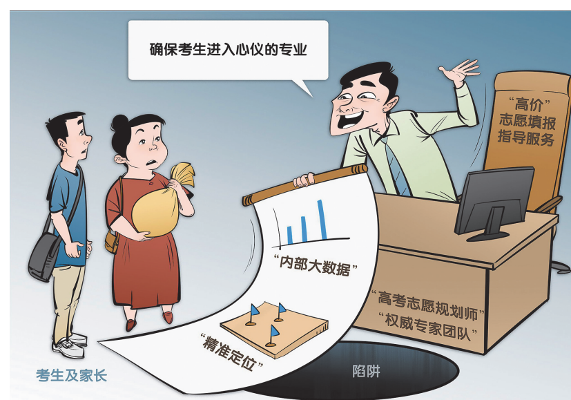
谨防“高价辅导”陷阱(漫画)

教育部介绍,高校招生实行计算机远程网上录取,各省(区、市)录取工作一般于7月上旬开始,8月底之前结束。高校一般会在录取结束后一周左右向录取新生寄发录取通知书。若考生在省级招生考试机构或高校官方网站上查询到了录取结果,一直没有收到录取通知书,可及时联系录取高校公布的招生咨询电话查询本人录取通知书邮寄情况。