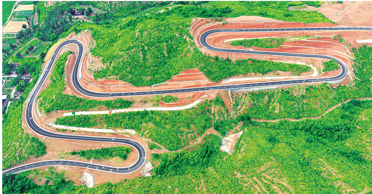
6月21日在垣曲县航拍的黄河一号旅游公路。该公路连接历山、望仙大峡谷、皇姑慢三景区，为历山镇、古城镇群众出行、销售农产品提供了更好的交通条件。

市司法局有关负责人说，行政执法监督员要当好“学习者”“监督员”“参谋员”“宣传员”，主动深入一线、积极收集线索、实时反馈问题、做好普法宣传，形成覆盖广、渠道通、响应快的监督信息网络，让监督“利剑”成为推进依法行政、建设法治政府的助推器。要始终坚持“内强素质、外树形象”，如实记录、准确反馈监督中发现的问题和情况，用实际行动投身平安运城、法治运城建设，不断扩大行政执法监督员的影响力和知晓度。