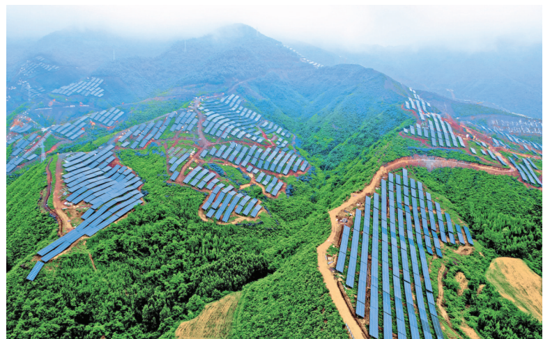
图为垣曲县100MW多能互补光伏发电项目。