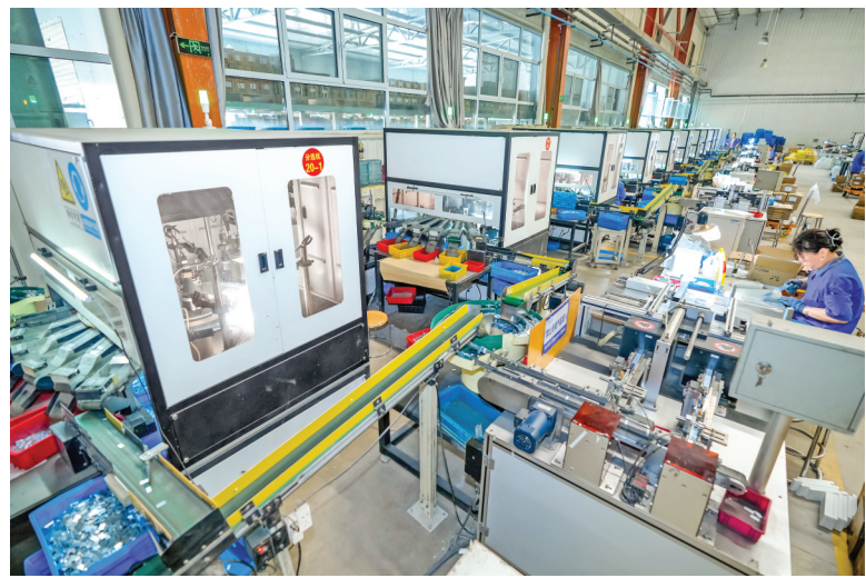
7月9日，位于盐湖高新区的中磁科技股份有限公司车间，工人在生产、检验、包装电机磁钢产品。中磁科技主要产品有轮毂电机磁钢、核磁共振磁钢、风力发电磁钢

等，广泛应用于汽车工业、医疗设备、能源交通、人工智能等领域。今年上半年，该企业生产磁钢毛坯4405吨，产值7.72亿元。