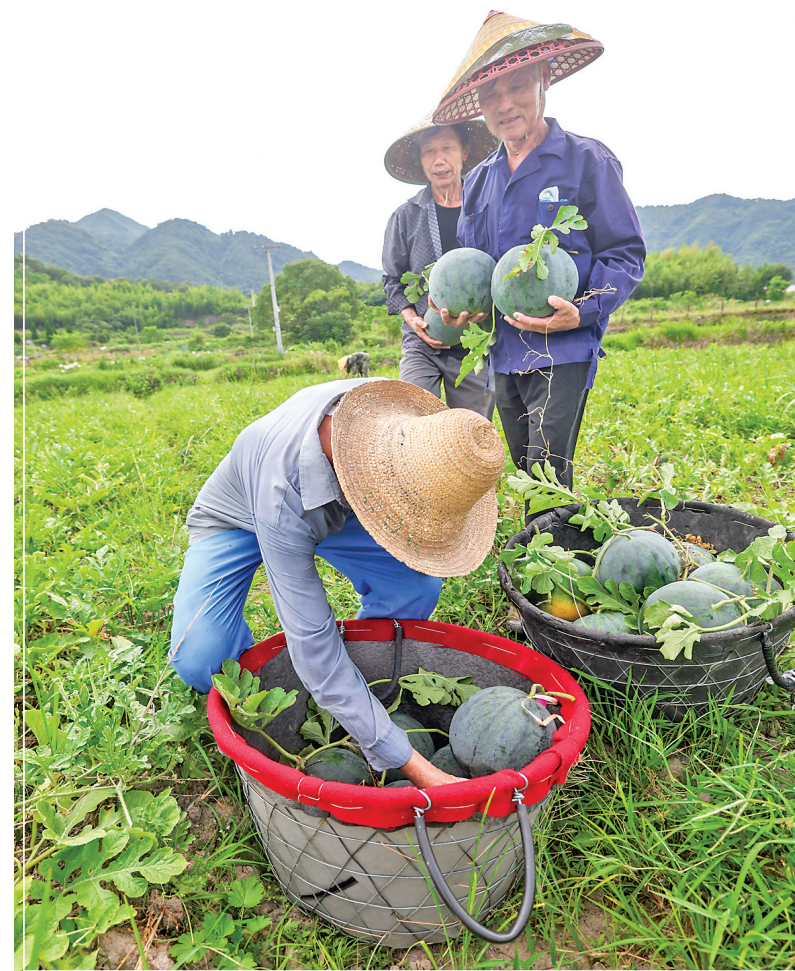
7月17日,浙江省诸暨市安华镇勾乘山村的西瓜种植户在种植基地采收西瓜。今年勾乘山村共种植西瓜300余亩,全部是浙江省农科院培育的新品种,预计实现销售额400余万元。

7月1日,国家文物局发布通知,明确重点场馆、热门场馆可根据实际情况,通过适当延长开放时间、策划云展览等方式,更大限度满足观众参观需求。记者注意到,多地博物馆纷纷在暑期延长开放时间,或推出“夜游”项目,打造“24小时博物馆”,为公众提供更多元的文化体验。(据新华社北京7月17日电)