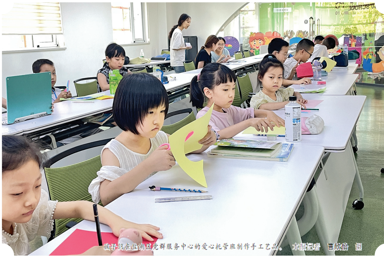
孩子们在盐湖区党群服务中心的爱心托管班制作手工艺品。

步入暑假，盐湖区党群服务中心愈发“忙碌”起来。河东书房·党群馆内，孩子们手捧绘本聚精会神地阅读；自习室里，备考的学生或埋头刷题，或默声背诵；红色放映厅内，一部红色影片正在放映，厅内座无虚席；舞蹈排练厅内，模特队刚结束排练，几个人围坐在一起短暂休息；党建文化长廊迎来一拨又一拨的市民参观打卡……在这里，无论是哪个年龄段的市民，都可以找到“家”的归属感。