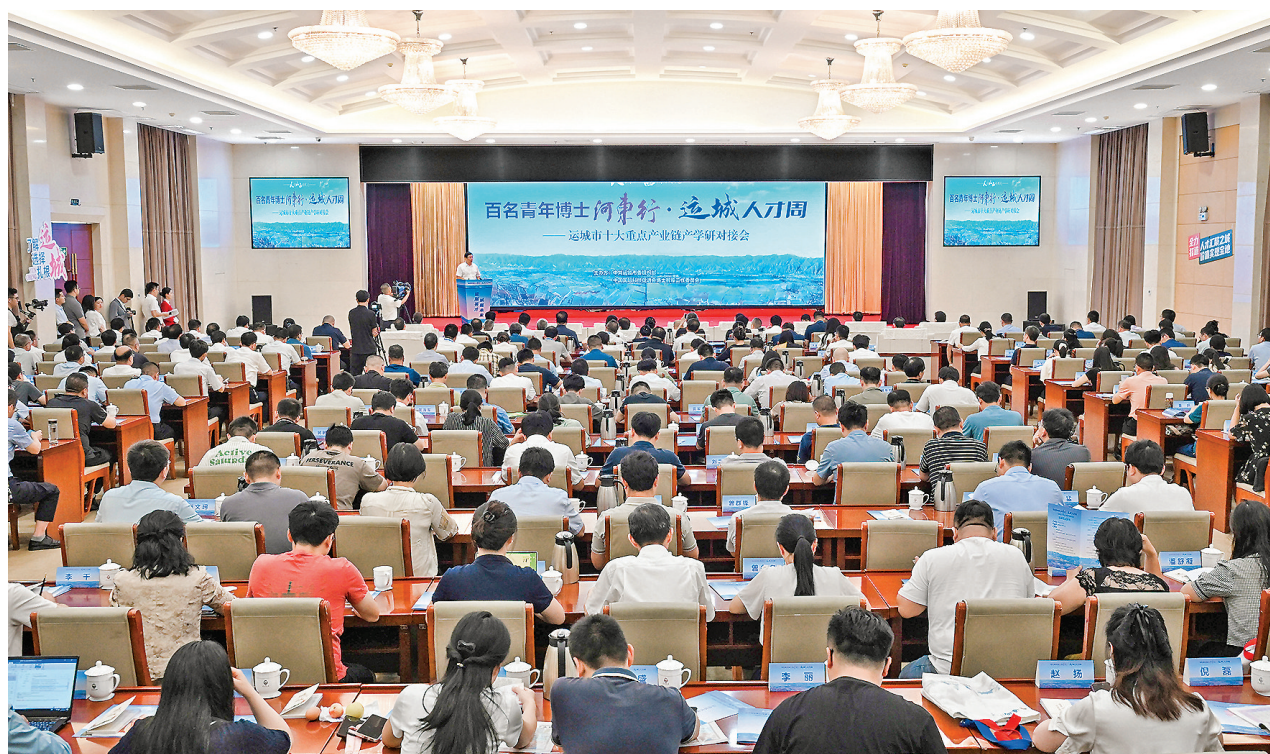
8月16日，百名青年博士河东行暨“运城人才周”启动仪式现场。