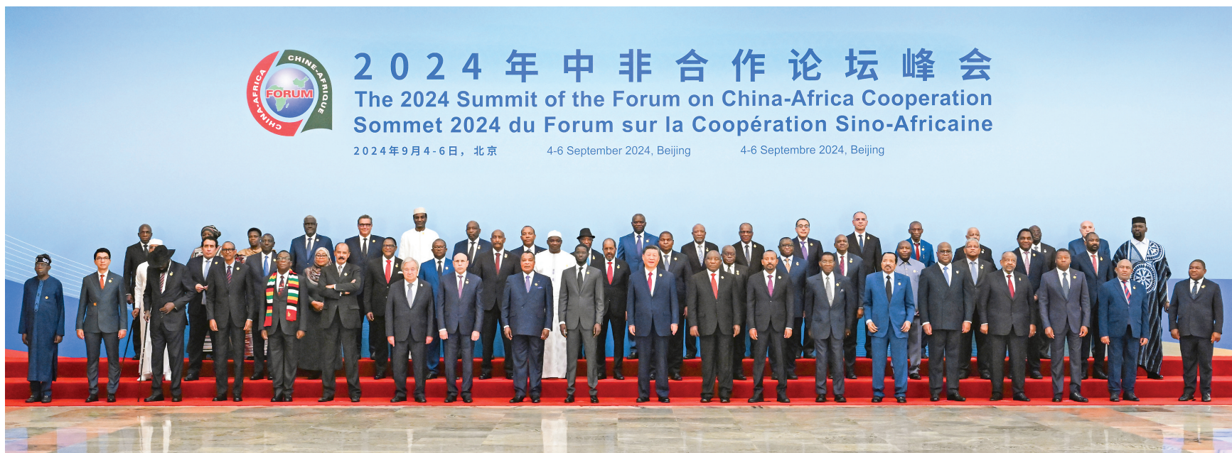
9月5日上午,国家主席习近平在北京人民大会堂出席中非合作论坛北京峰会开幕式并发表主旨讲话。这是开幕式前,习近平同出席峰会的外方领导人集体合影。