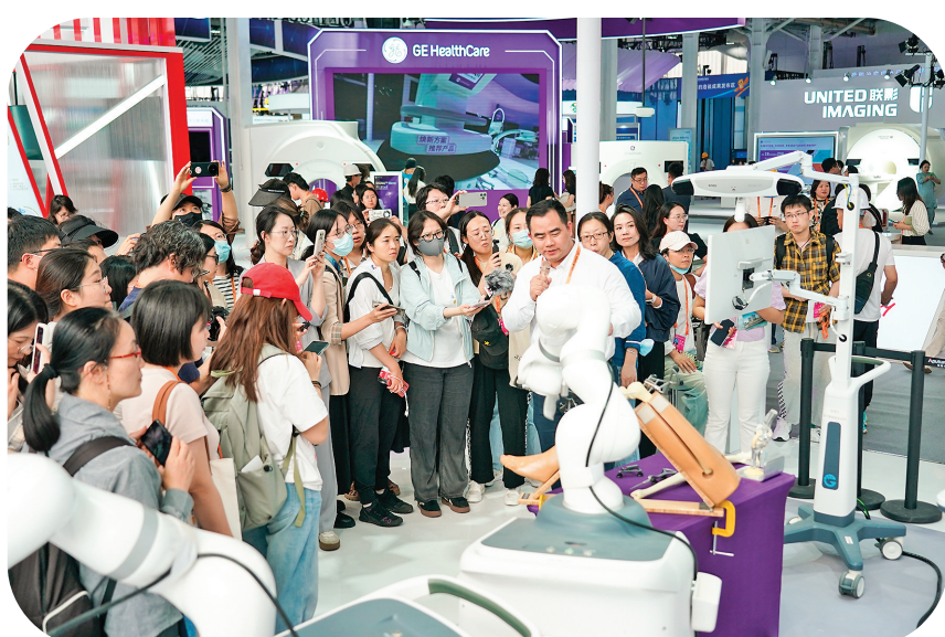
9月11日,记者在服贸会首钢园区健康卫生服务馆采访。