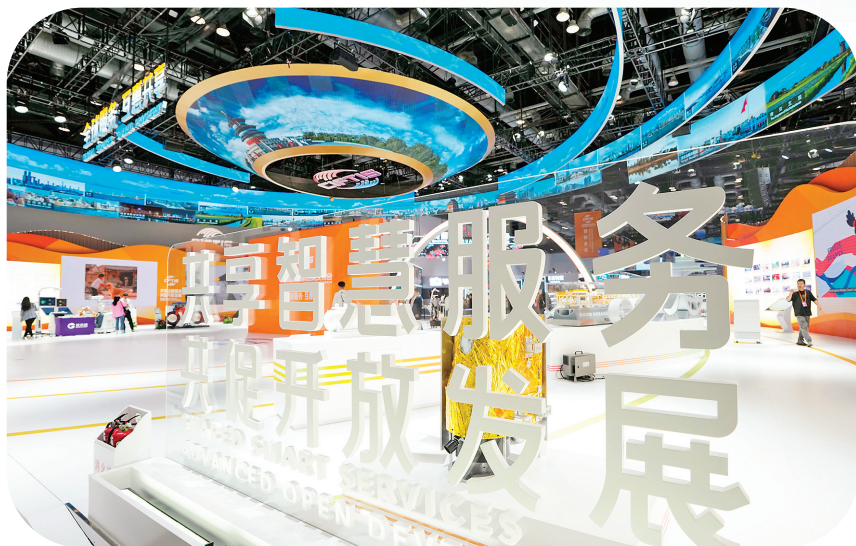
这是2024年9月11日拍摄的国家会议中心内景。