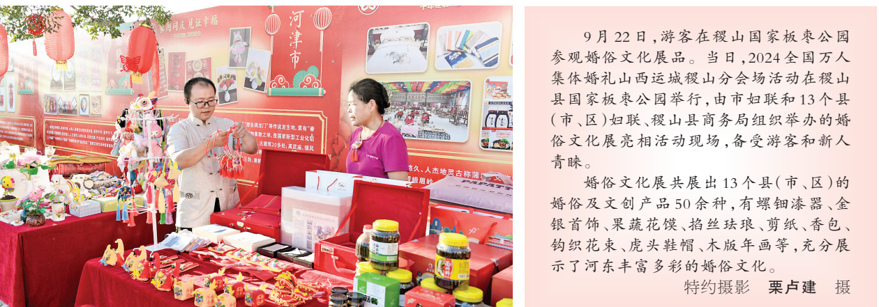
9月22日,游客在稷山国家板栗公园参观婚俗文化展品。当日,2024年全国万人集体婚礼山西运城稷山分会场活动在稷山县国家板栗公园举行,由市妇联和13个县(市、区)妇联、稷山县商务局组织举办的婚俗文化展览展示活动现场,备受游客和新人青睐。 婚俗文化展共展出13个县(市、区)的婚俗及文创产品50余种,有螺钿漆器、金银首饰、果蔬花馍、掐丝珐琅、剪纸、香包、针织花束、虎头鞋帽、木版年画等,充分展示了河东丰富多彩的婚俗文化。