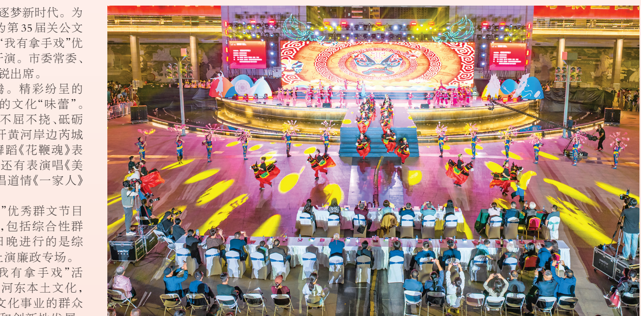
9月23日,运城市第七届“我有拿手戏”优秀群文节目大展演在中心城区南风广场开演。

本报讯(记者 王月文)礼赞新中国,逐梦新时代。为庆祝新中国成立75周年,9月23日晚,作为第35届关公文化旅游节的重要活动之一,运城市第七届“我有拿手戏”优秀群文节目大展演在中心城区南风广场开演。市委常委、运城军分区大校司令员郭新武,副市长张锐出席。 当晚,南风广场华灯璀璨,歌舞欢腾。精彩纷呈的开场舞《我有拿手戏》,瞬间激起了人们的文化“味蕾”。紧接着,高潮《砥柱魂》展现了平陆儿女不屈不挠、砥砺奋进的精神风貌;鼓乐《麦子熟了》铺展开黄河流域百姓勤劳播种、喜获丰收的生活画卷;舞蹈《花鞭魂》表达出垣曲人民积极向上的生活追求……还有表演演唱《美丽闻喜我的家》、秧歌舞《回门》、河东说唱道情《一家人》等,给广大观众带来了别样的视听享受。 据介绍,运城市第七届“我有拿手戏”优秀群文节目大展演由市文旅局主办、市文化馆承办,包括综合性群文节目专场和廉政专场两个场次。23日晚进行的是综合性群文节目专场,24日晚在南风广场上演廉政专场。 市文旅局有关负责人表示,开展“我有拿手戏”活动,通过“群众编、群众演、群众评”,挖掘河东本土文化,传承优秀民间艺术,有助于进一步扩大文化事业的群众基础,助推优秀传统文化的创造性转化和创新性发展,促进社会主义文化繁荣兴盛,不断增强老百姓的获得感、幸福感。