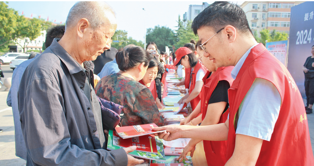
▲近日,闻喜县社区服务中心西湖社区在县人民广场参加县科协组织的“全国科普日”宣传活动。此次“全国科普日”活动,让广大居民了解到更多与生活健康相关的知识,为提高居民生活质量奠定了良好的基础。

医保制度是保障人民健康的一项基本制度。国家建立基本医疗保险制度,就是为了减轻老百姓的经济负担,防止“因病致贫”。我市基本医疗保险住院年度最高支付限额为7万元,政策范围内报销比例达到70%左右,大病保险不用另行缴费,参加基本医保,自动享受大病报销待遇,大病保险年度最高支付限额达40万元,可大大减轻家庭的经济负担,因此,按时按标准缴纳医保费用不仅是给自己的一份保障,充实的医保基金池也在一定程度上帮助了他人。