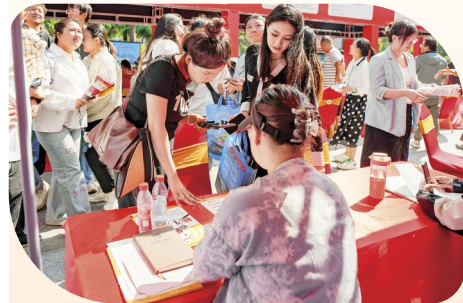
▲毕业生手持简历,穿梭于各企业展位之间。