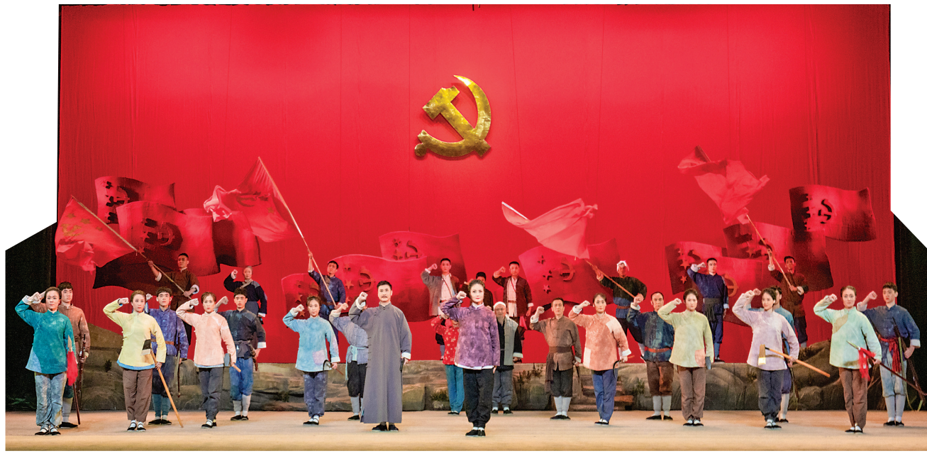
蒲剧《中条山上党旗红》剧照。

本报讯(记者 游映霞)10月4日、5日晚,山西省庆祝中华人民共和国成立75周年优秀剧目展演作品蒲剧《中条山上党旗红》在太原青年宫演艺中心连演两场,现场座无虚席,精彩的演出让观众大呼过瘾。演出不仅带来了一场蒲剧的视觉盛宴,更让观众接受了一次深刻的爱国主义教育。