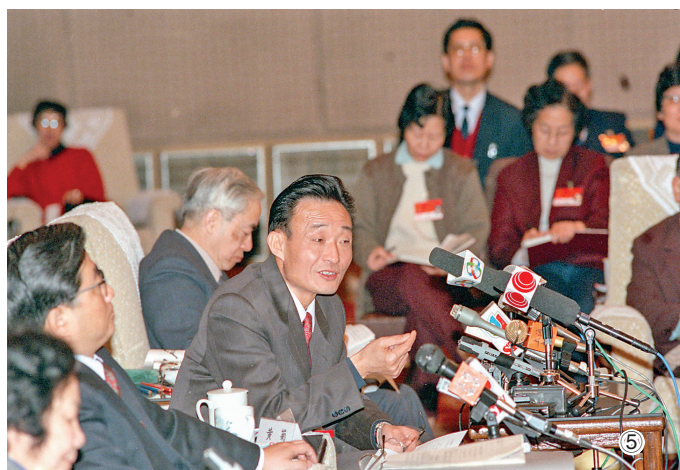
图⑤：1994年3月，时任上海市委书记的吴邦国同志在全国两会上海代表团全会上发言。新华社记者 刘建国 摄

1994年9月，吴邦国同志在中共十四届四中全会上增补为中央书记处书记。1995年3月，任国务院副总理，负责国有企业改革、工交生产、基础设施建设等方面工作。其间，兼任国务院三峡工程建设委员会副主任、中央大型企业工委书记、中央企业工委书记等。他强调国有企业改革是整个经济体制改革的中心环节，坚持社会主义市场经济改革方向，正确处理改革发展稳定的关系，大胆创新、勇于实践，从纺织行业开始，从龙头骨干企业入手，一个行业一个行业地攻坚克难，为深化国有企业改革做了大量卓有成效的工作。在中央政治局常委会领导下，他主持起草《中共中央关于国有企业改革和发展若干重大问题的决定》，全面总结国有企业改革和发展的基本经验，明确国有企业改革和发展的指导方针，提出搞好国有企业改革和发展的一系列重大政策措施。他认真落实党中央和国务院决策部署，坚持改制改组改造和加强管理相结合，推动国有大中型企业改革和脱困三年目标如期基本实现。他高度重视加快现代企业制度建设，按照“产权清晰、权责明确、政企分开、管理科学”的要求，积极推行规范的公司制和股份制改革，完善法人治理结构，深化企业内部分配、人事、劳动制度改革，推动国有大中型骨干企业建立现代企业制度。他着力推动建立企业优胜劣汰机制，坚持从战略上调整国有经济布局和改组国有企业，支持具有优势的大公司大企业集团进一步做强做大，使其成为国民经济重