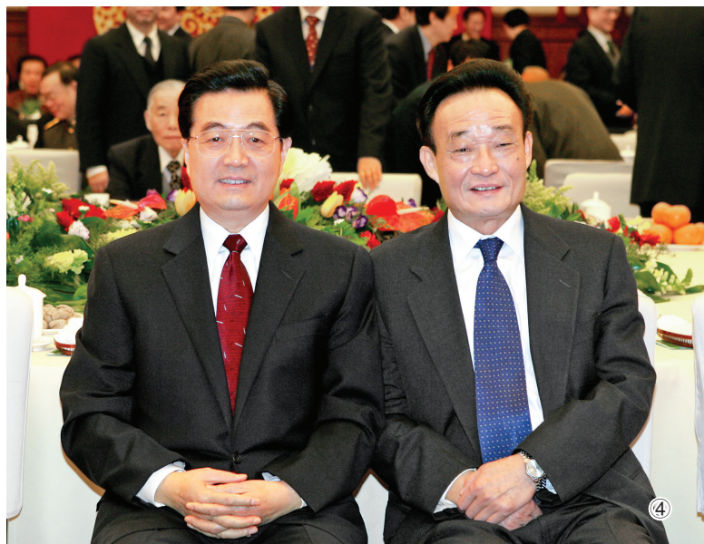
图④：二〇〇五年一月一日，全国政协在北京举行新年茶话会。这是胡锦涛同志与吴邦国同志在一起。