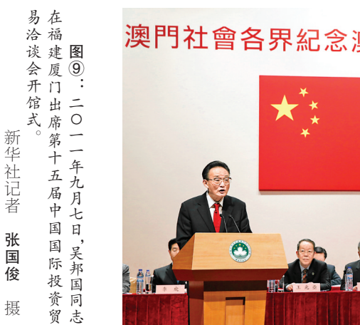
图⑫：2013年2月21日，吴邦国同志在澳门文化中心出席澳门社会各界纪念澳门基本法颁布20周年启动大会并发表讲话。