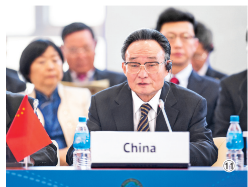
图⑪：2013年1月28日，吴邦国同志在俄罗斯符拉迪沃斯托克出席亚太议会论坛第21届年会，并作题为《坚持和平发展 促进合作共赢》的主旨发言。