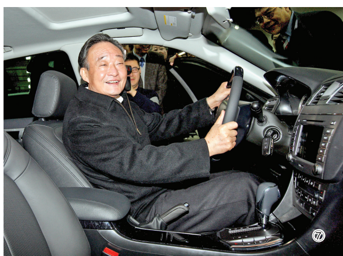
图⑦：2010年1月30日，吴邦国同志在上海汽车集团股份有限公司技术中心察看新能源样车。