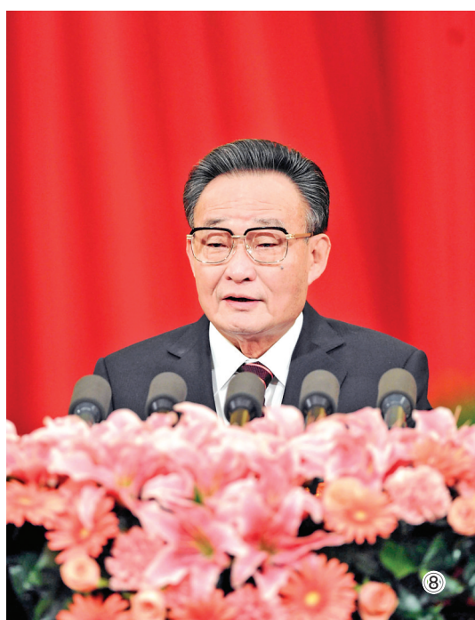
图⑧：二〇一一年三月十日，十一届全国人大四次会议在北京人民大会堂举行第二次全体会议，吴邦国同志作全国人大常委会工作报告。