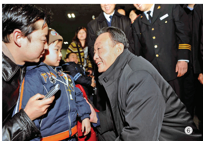
图⑥：2008年2月3日，吴邦国同志在北京西站候车室与旅客交谈。