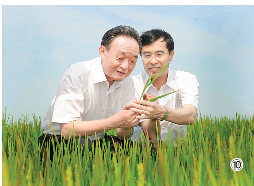
图⑩：2012年7月19日，吴邦国同志在黑龙农垦建三江管理局二道河农场万亩大地号察看水稻长势。