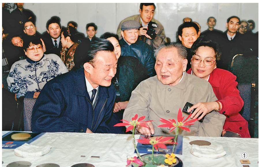
图①：1992年2月10日，邓小平同志在上海贝岭微电子制造有限公司参观时与吴邦国同志交谈。