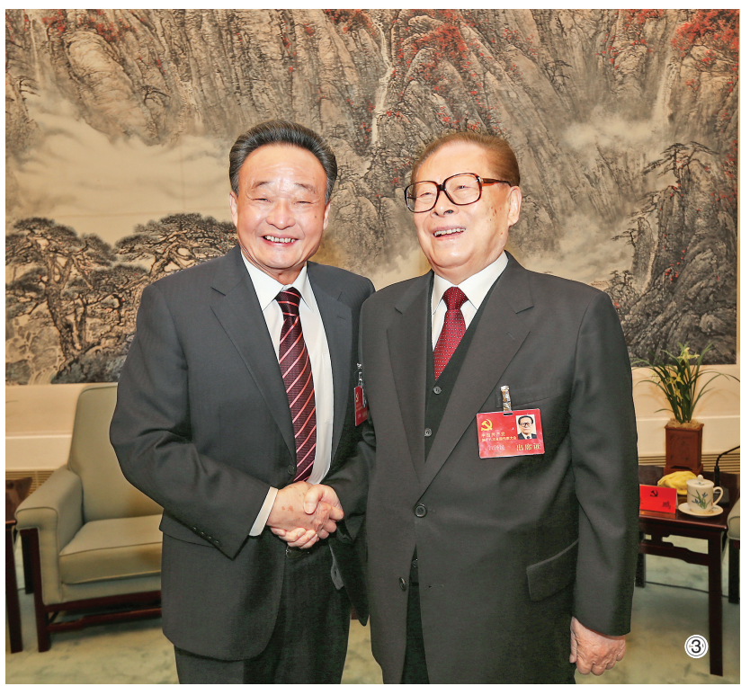
图③：2012年11月14日，中国共产党第十八次全国代表大会在北京闭幕。这是闭幕会前，江泽民同志与吴邦国同志在一起。