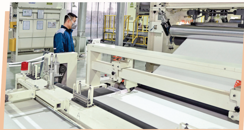
▲永济市山西纳博科环保科技有限公司高性能环保新材料生产项目。

本版策划 雷哲侠 本版责编 金玉敏 美编 冯满楠 校对 乔植