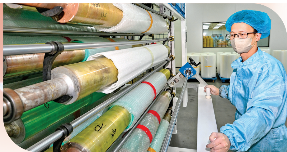
▲盐湖区国森彩印有限公司扩建年产5000吨新材料医药包装材料生产线项目