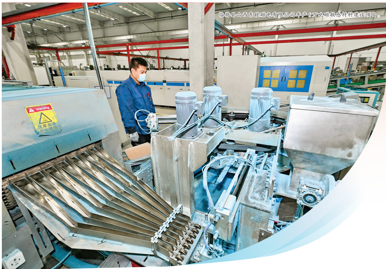
临猗县山西东睦磁电有限公司年产6万吨磁敏材料建设项目。