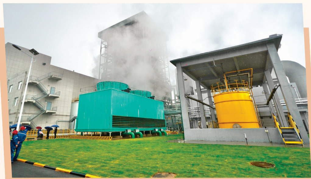
▲稷山县东方资源发展集团有限公司135MW超超临界煤气综合利用分布式发电项目。