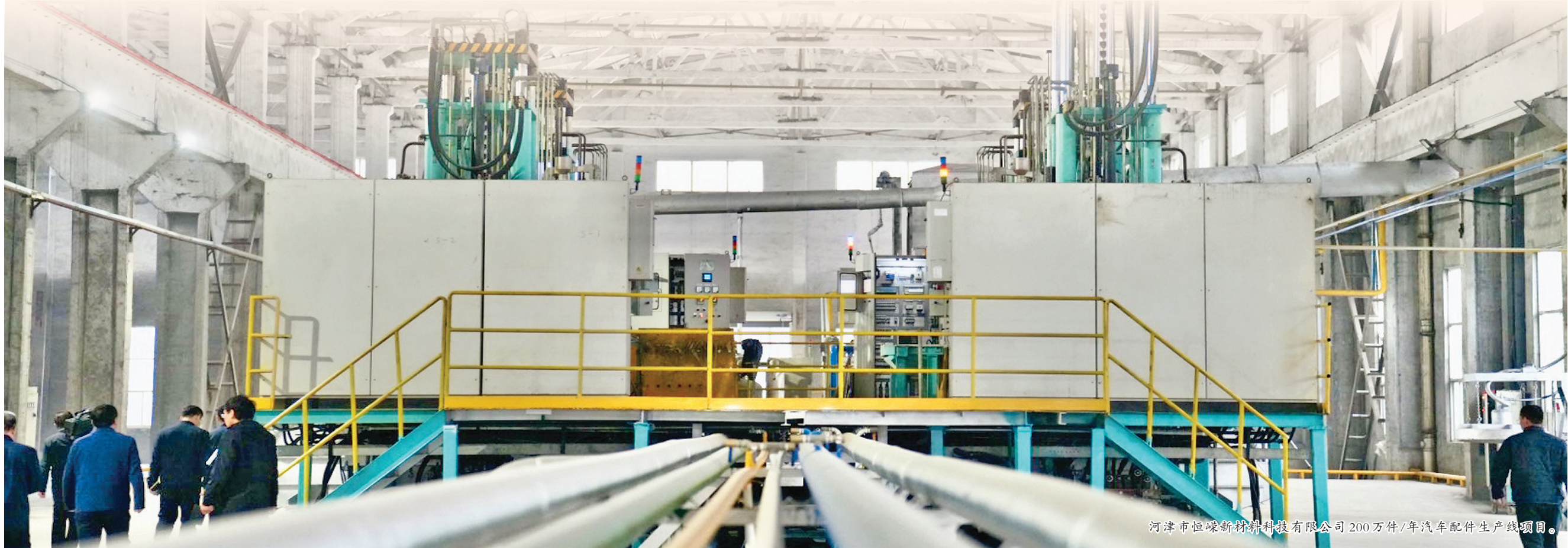
天津市恒烁新材料科技有限公司200万件/年汽车配件生产线项目。