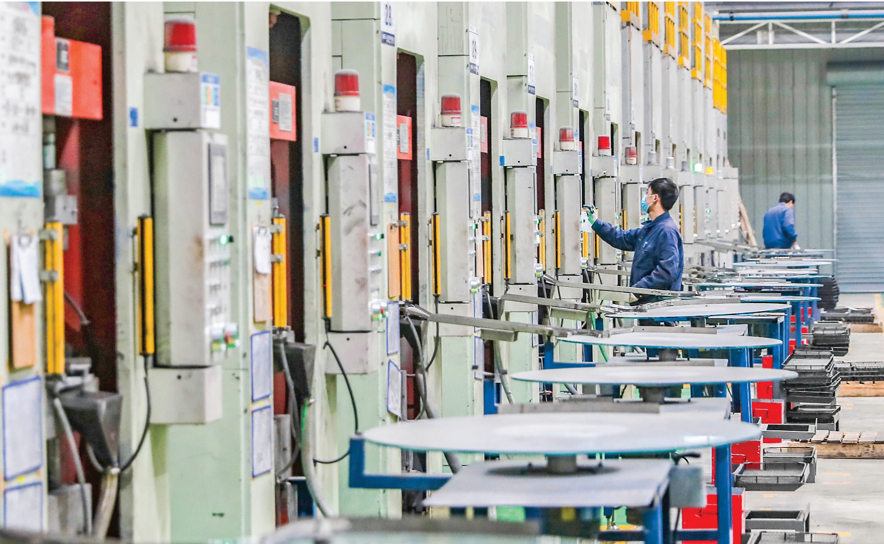
11月13日，位于临猗现代农业产业示范区的山西东睦磁电有限公司生产车间内，工人在加紧生产。

目前，运城盐湖国际机场开通35条航线，通达36个主要城市，引进国航、深航、东航、南航、厦航、昆明航、西藏航等7家航空公司，为运城高质量发展提供了有力保障。