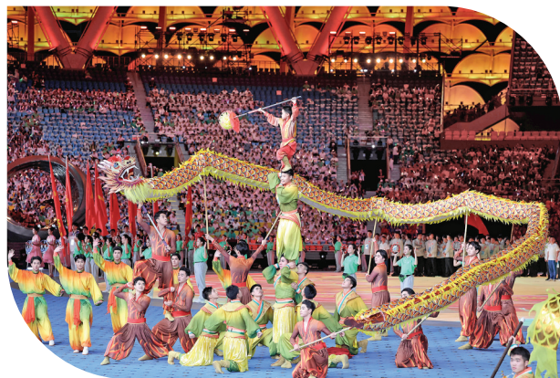
右图:11月22日,演员在开幕式上表演。