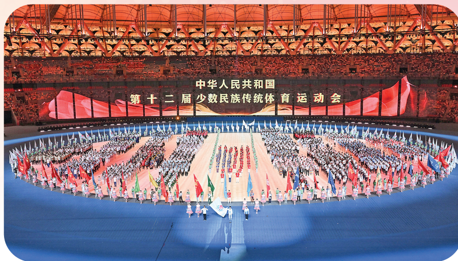
11月22日,中华人民共和国第十二届全国少数民族传统体育运动会开幕式在海南省三亚市举行。