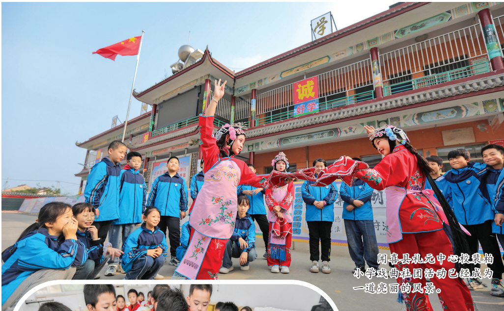
同喜县礼元中心幼儿园小学戏曲社团活动已经成为一道亮丽的风景。

目前，全市各地校外培训机构在“全国中小学生学习校外培训管理服务平台”完成注册，并实行动态更新黑白名单，指导家长树立正确的育儿观、成长观，减少盲目性和跟风心理，避免“校内减负、校外增负”。校外培训机构培训行