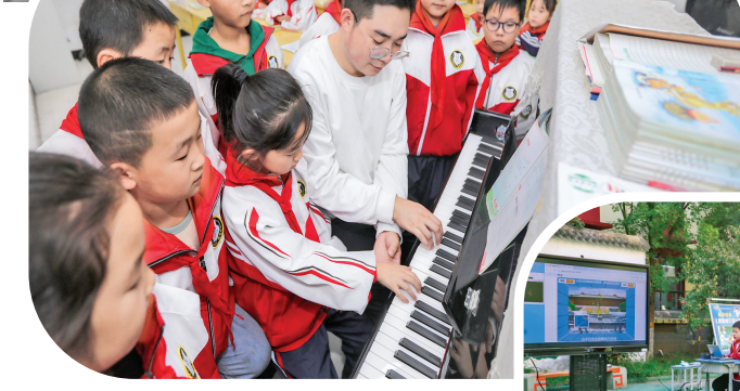
平陆县下坪中心校音乐教师教山区孩子学钢琴。