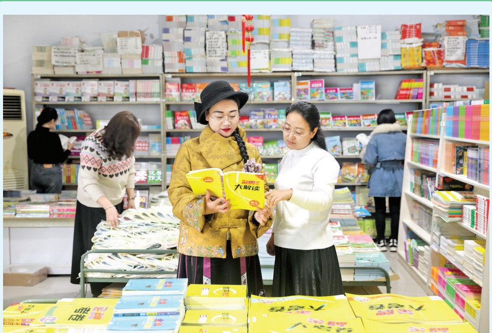
11月25日，在盐湖区图书大世界书店，家长在为孩子免费领取学习资料。连日来，为了回馈社会，该店开展“赠书筑梦”爱心活动，为盐湖区城乡辖区的小学生免费赠送6000余份学习材料。截至目前，已经发放2000余份。