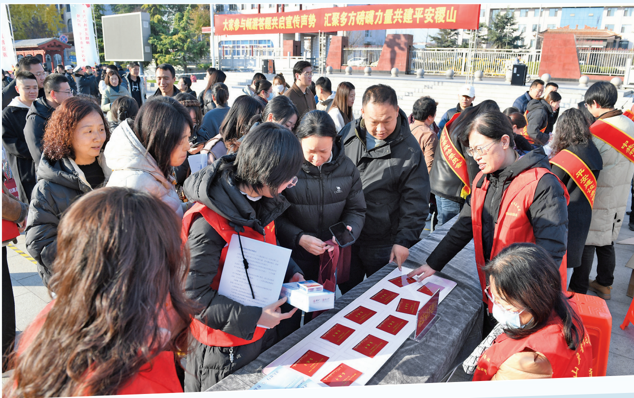
12月3日，稷山县市民在稷王文化广场参与宪法和法律知识答题竞赛活动。当日，稷山县2024年宪法宣传周暨平安建设宣传周活动启动。此次活动开展形式多样的宪法宣传教育