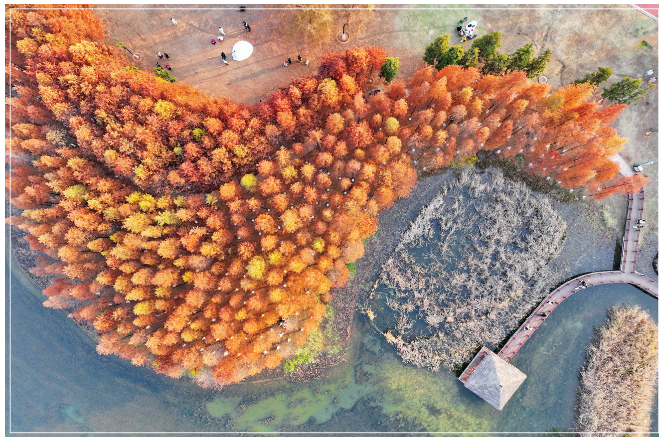
这是12月18日在湖南松雅湖国家湿地公园拍摄的水杉。近日，位于湖南省长沙市长沙县的湖南松雅湖国家湿地公园的水杉迎来了最佳观赏期，吸引市民前来游玩打卡。

我坚信，在习近平主席亲切关怀和中央政府的大力支持下，第六任行政长官岑浩辉先生必将带领新一届特别行政区政府和社会各界，谱写出具有澳门特色的“一国两制”实践新篇章。蔡奇、李鸿忠、何卫东、何立峰、王小洪、王东峰、夏宝龙等出席欢迎晚宴。全国政协副主席何厚铤、香港特别行政区行政长官李家超，澳门特别行政区候任行政长官岑浩辉、前任行政长官崔世安，澳门特别行政区政府主要官员、澳门各界代表等也出席晚宴。