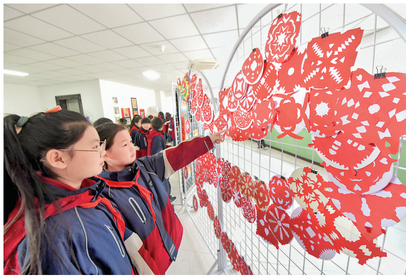
12月26日,河北省石家庄新乐市新华路小学学生在观看“庆元旦·迎新年”学生书画美术作品展览。

但记者采访了解到,多地优化课桌椅配置尚存现实掣肘。“一些地方将此项工作纳入‘民生实事’项目后见效较快,但资金不充裕的地区往往推进较慢。”受访教育人士表示,推动可调节课桌椅、可躺课桌椅进校园仍需加大资金投入。