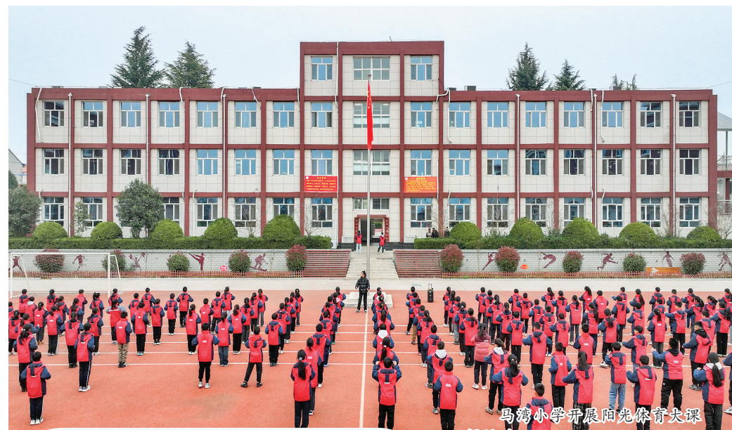
马湾小学开展阳光体育大课间活动。

去年,马湾小学开展了“桃花灼灼·点亮春天”及“感知秋天”的跨学科主题活动,融合了语文、数学、英语、科学等学科,引导学生亲近自然,热爱生活,崇尚环保,传递正能量,驱动教师将课内与课外、理论和实际连接起来,进一步推进学校课程融合发展。