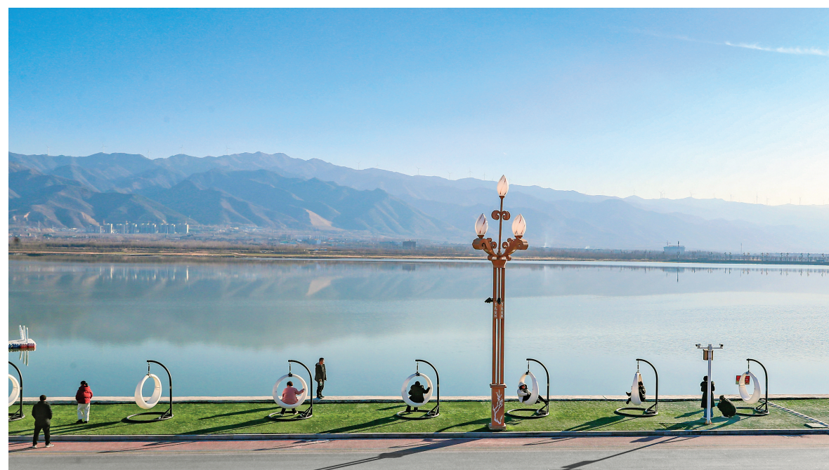
一月六日，游客在运城盐湖景区游玩。近年来，我市持续以“生态优先、保护为主、适度开发”为遵循，促进盐湖生态环境不断改善。本报记者 金玉敏 摄

高效联动、同题共答的闭环工作体系。要盯紧目标、从头抓紧。锚定全年经济社会发展目标任务，以开局即决战、起步即冲刺的奋进姿态，抓紧抓实各项工作，奋力实现一季度“开门红”。要狠抓落实、强化执行。坚持抓总抓重抓要，细抓产业、大抓工业、主抓企业、狠抓项目，做到干在先、干在要、干在实、干出效，推动全年工作开好局、起好步。会议还研究了其他事项。