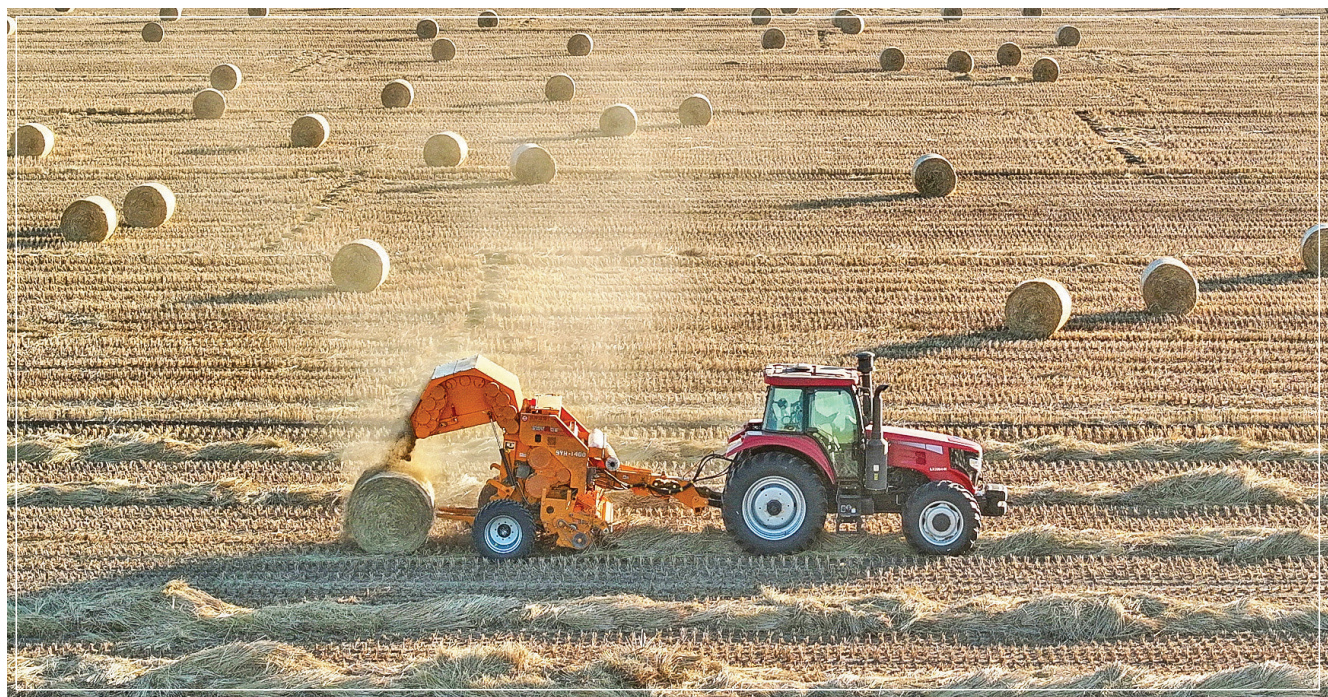
1月7日，在唐山市曹妃甸区第八农场田间，农机手驾驶农机将稻草回收打捆(无人机照片)。近年来，河北省唐山市曹妃甸区积极探索秸秆利用新

途径，将稻草集中收集用于牲畜饲料、稻草制品加工、生物质发电等，有效提高了秸秆综合利用率，促农增收，实现农业绿色循环发展。