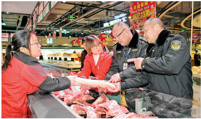
1月13日，闻喜县市场监督管理局执法人员在一超市开展春节前的执法检查。

下一步，该校将持续推进省级铸魂育人项目建设，进一步丰富项目内容、创新活动载体、突出职教特色、强化实践育人、完善运行机制，推动形成具有运城师专特色的职业教育铸魂育人氛围，大力培养更多德才兼备、德技并修、全面发展的高素质人才。