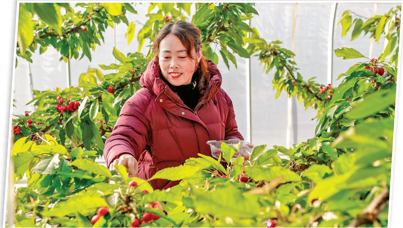
临近春节，平陆县官镇部官村的现代农业采摘园里，大棚樱桃迎来开园采摘季。

行交流分享。他从多方面、多角度激励党员干部勇于走出舒适区，以奋斗者、上进者、富有者的姿态，在新时代新征程彰显新担当、展现新作为。该局有关负责人表示，将以此次培训为契机，认真消化吸收、学以致用，始终做到勤于学习、善于思考、提升能力，力争在思想上有收获、在能力上有提升、在工作上有所作为，为奋力谱写中国式现代化运城新篇章贡献“三农”力量。