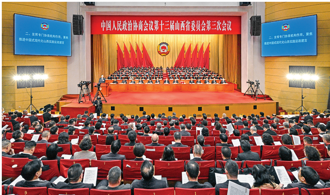
1月16日,中国人民政治协商会议第十三届山西省委员会第三次会议在太原隆重开幕。图为大会会场。