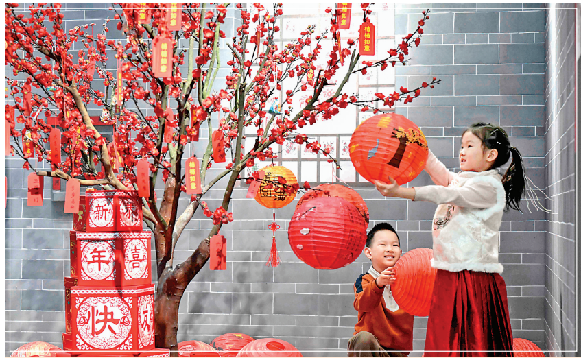
▲1月16日,小朋友在河北省群众艺术馆迎新春节民俗文化展览活动中悬挂灯笼。当日,河北省群众艺术馆(河北省非物质文化遗产保护中心)举办迎新春节民俗文化展和系列民俗体验活动。

日前,国务院办公厅转发生态环境部《关于建设美丽中国先行区的实施意见》。这份文件明确,分级分类建设美丽中国先行区,到2027年底前形成一批实践创新和制度创新成果,久久为功建成若干各美其美、群众满意的示范样板,为全面推进美丽中国建设积累经验、树立标杆。 文件提出,在省域层面,重点支持5个左右省份开展先行区建设。在城乡领域,重点支持50个左右城市、100个左右县开展先行区建设,率先形成一批美丽城市、美丽乡村建设示范标杆。 生态环境部有关负责人表示,建设美丽中国先行区是全面推进美丽中国建设的重要抓手,是构建美丽中国建设新格局的关键支撑。 据介绍,当前,我国正在形成“1+1+N”的美丽中国建设实施体系——第一个“1”是《中共中央 国务院关于全面推进美丽中国建设的意见》,这是统领美丽中国建设各项举措的纲领性文件。 第二个“1”是美丽中国先行区建设,是推进美丽中国建设的重要抓手。此次发布的《关于建设美丽中国先行区的实施意见》,对建设美丽中国先行区作了安排部署。 “N”是指分领域行动,按照条块结合的思路进行布局,生态环境部联合相关部门出台系列行动方案,既包括城乡建设领域的美丽城市、美丽乡村,也包括清洁能源、环境治理、绿色制造、绿色交通、绿色金融、科技创新等其他重点领域。目前,各分领域行动方案均在积极推进中。 此次发布的实施意见提出,在区域、省域、城市、县域各层级,聚焦推动绿色低碳发展、促进生态环境根本好转、加强生态保护修复、筑牢生态安全底线、深化生态文明体制改革等目标任务,分级分类建设美丽中国先行区。 建设美丽中国先行区如何分级分类推进? 这位负责人表示,坚持全国一盘棋,一体部署重大战略区域、省域和美丽城市、美丽乡村建设,鼓励各地因地制宜开展示范创新。 区域层面,紧扣高质量发展要求,深入落实区域协调发展战略和区域重大战略,京津冀加快建设减污降碳协同和生态修复示范区,长三角建设高水平保护推动高质量发展样板区,粤港澳共同建设融合创新美丽湾区,长江流域建设绿色低碳发展示范带,黄河流域推动上中下游协同保护和治理,聚焦流域性、跨省共性问题,加强区域绿色发展协作,深化生态环境共保联治,打造绿色发展高地带。 省域层面,本着少而精、示范性、带动性强的原则,坚持一省域一特色,重点支持5个左右省份开展先行区建设。充分发挥省域在美丽中国建设中的主体作用,在推动绿色低碳发展、促进生态环境根本好转、加强生态保护修复、筑牢生态安全底线和深化生态文明体制改革五个方面走在前、作表率。 实施意见提出,统筹城乡推进美丽中国建设行动,聚焦城乡生态环境保护重点领域和突出问题,探索城市、整县推进美丽中国建设实践的新机制、新模式,引导全社会积极行动。 这位负责人表示,高标准建设美丽城市,重点支持50个左右城市以绿色低碳、环境优美、生态宜居、安全健康、智慧高效为导向,推进新时代美丽城市建设;因地制宜建设美丽乡村,选择不同主体功能定位的县,重点支持100个左右县以生态环境综合治理、“两山”转化、农业绿色发展、促进宜居宜业为重点,整县推进美丽乡村建设。 记者了解到,这份实施意见在资金支持、市场机制、科技支撑等方面强化政策支持引导,调动各方面的积极性、主动性和创造性,形成工作合力。 (新华社北京1月16日电)