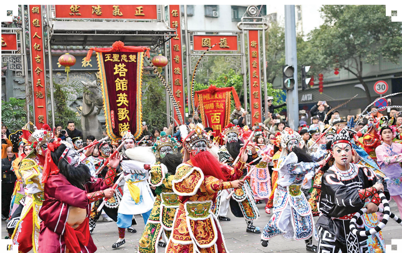
1月23日,在广东汕头市潮阳区,塔馆英歌队队员在街头表演“中华战舞”。