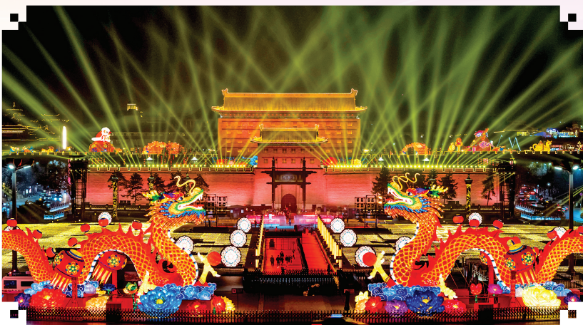
1月22日晚,2025乙巳蛇年“长安灯会”在陕西西安正式启幕。这是西安城墙永宁门前的巨型花灯(无人机照片)。