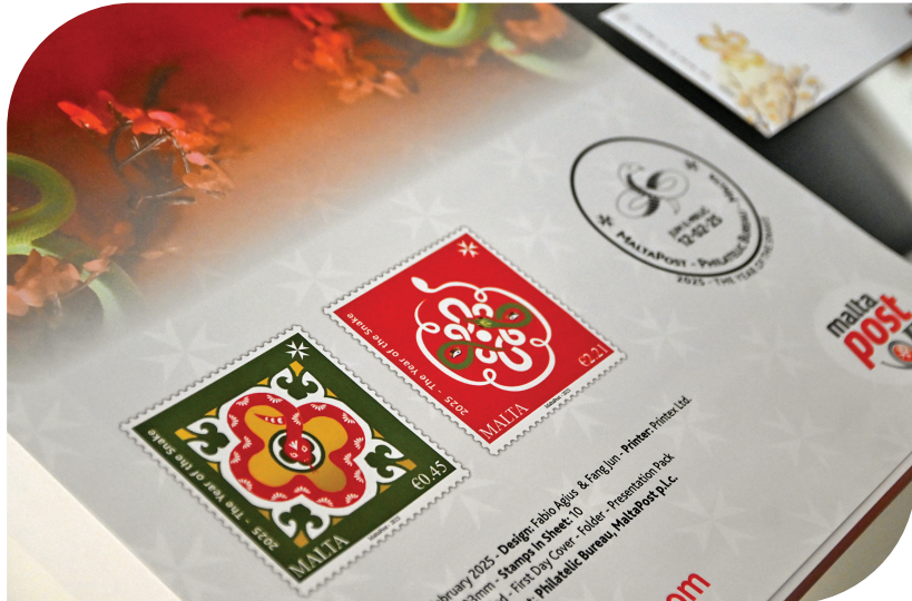
这是2月12日在马耳他瓦莱塔举行的蛇年生肖邮票发行仪式上拍摄的蛇年生肖邮票。

英大泰和人寿保险股份有限公司山西分公司 关于运城中心支公司换发《保险许可证》的公告 英大泰和人寿保险股份有限公司运城中心支公司营业场所为“山西省运城市周西路与魏风街交汇处中银大厦(安惠苑商务楼)8层804-809室变”更为“山西省运城市新市区盐湖大街以北周西路以东河东街以南水岸华庭22幢19层1902号、1903号及1904房间”。 现将变更后的许可证公告如下: 机构名称:英大泰和人寿保险股份有限公司运城中心支公司 机构住所:山西省运城市新