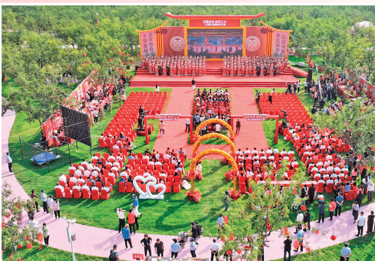
▲2024年全国万人集体婚礼山西运城分会场活动在稷山国家板栗公园举办。

元；社会消费品零售总额完成27.8亿元，增速4%；一般公共预算收入完成3.1亿元。