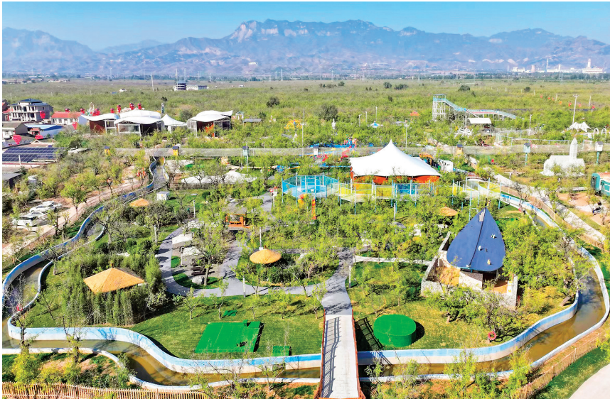
▲高质量打造“守望千年，只为来你”乡村振兴示范园区，让万亩田园真正托起百姓的致富梦、幸福梦。

增强“政治意识、责任意识、攻坚意识、创新意识、清廉意识”五种意识，聚力真抓实干，积极奋进，在经济建设主战场上大显身手、建功立业。