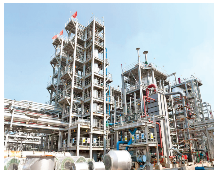
永东化工煤焦油精细加工及特种炭黑项目顺利投产。