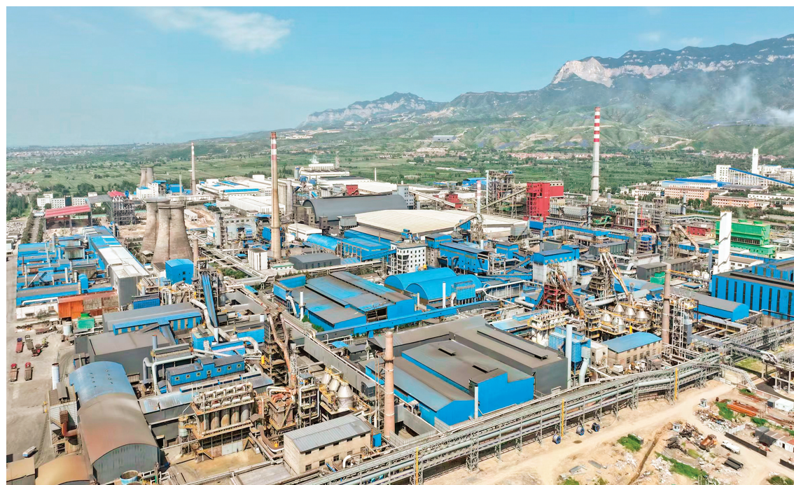
山西东方资源发展集团有限公司生产正忙。

社会治理全面加强。深入开展“化解矛盾纠纷 维护社会稳定”专项治理，切实把各类风险矛盾化解在基层。常态化开展扫黑除恶斗争，严厉打击电信网络诈骗等各类犯罪，破获刑事案件299起，社会治理现代化水平不断提高。