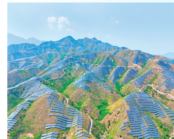
冀能100MW集中式光伏发电项目助力绿色发展。