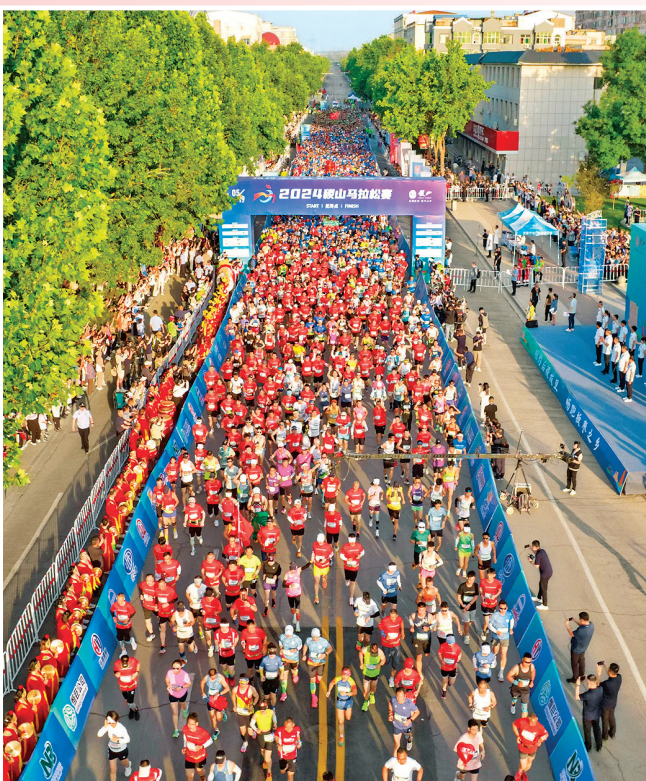
▲2024 稷山马拉松赛吸引全国4000余名选手畅跑后稷故里。