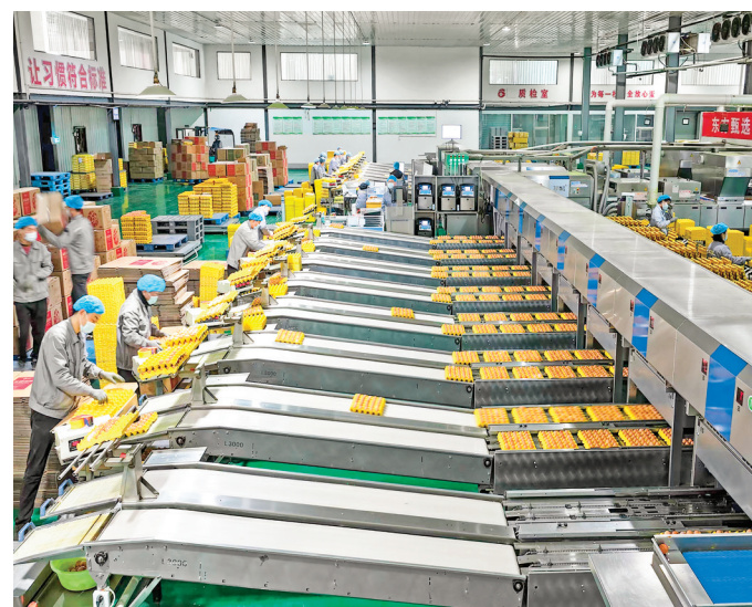
晋龙集团棉峪口蛋鸡养殖基地自动化分拣线有序运转。