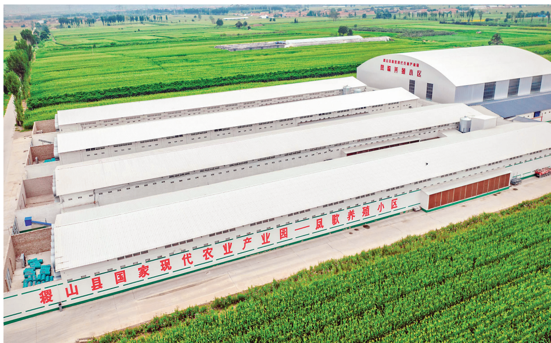
建成国家现代农业产业园，推动特色产业蓬勃发展。

2024年，稷山县GDP完成120.8亿元，增速4.8%；规上工业增加值完成28亿元，增速4.9%；固定资产投资完成43.6亿