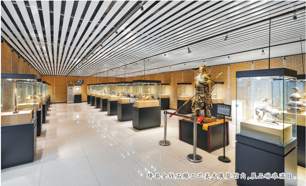
绛县金钱石雕工艺美术展览馆内，展品琳琅满目。