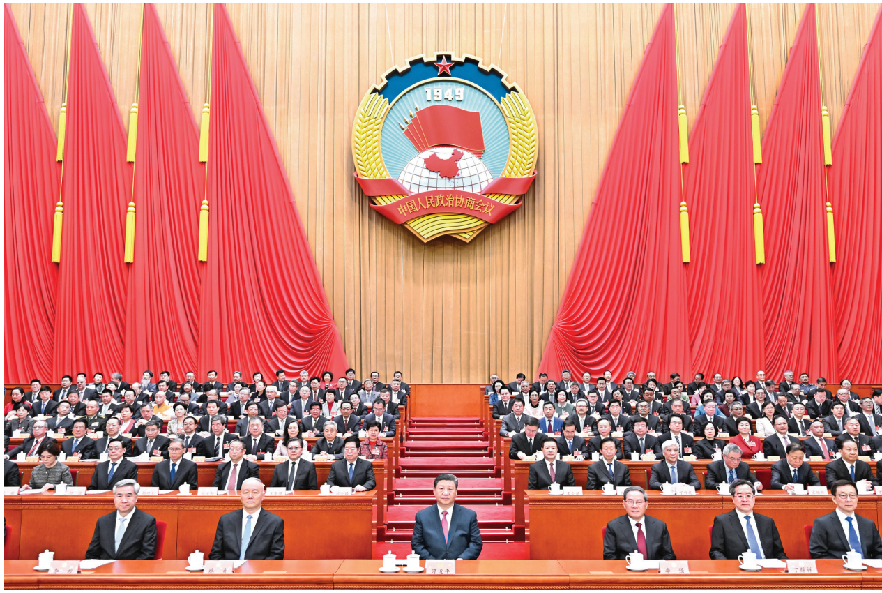
3月10日上午，中国人民政治协商会议第十四届全国委员会第三次会议在北京人民大会堂闭幕。这是习近平、李强、蔡奇、丁薛祥、李希、韩正在主席台就座。